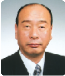
町長 三浦 正名

多様化、個性化が進む現代において行政への要望は、複雑多岐にわたり、ますます高度化してきています。五戸町は、町民のみなさんのニーズを的確に判断し、施策に反映させ、「豊かで住みよい町づくり」を推進していきます。