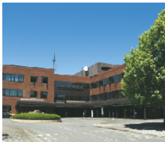
五戸町役場 本庁舎