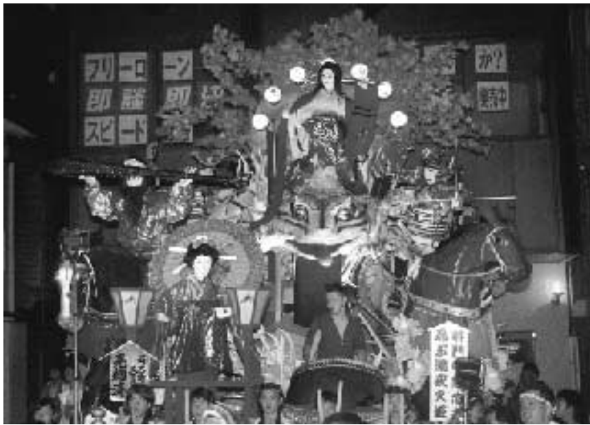
▲ 特別賞 上大町自治会「将門の無念を忍ぶ滝夜叉姫」