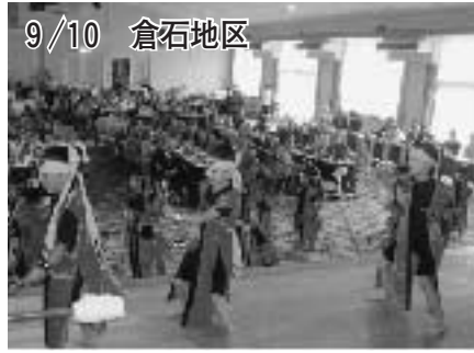
9/10 倉石地区 倉石保育所の子どもたちがよさこいソーランを披露