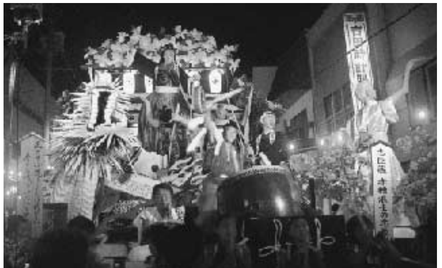
▲ 奨励賞 新丁新町青年部「忠臣蔵 赤穂浪士の忠義」