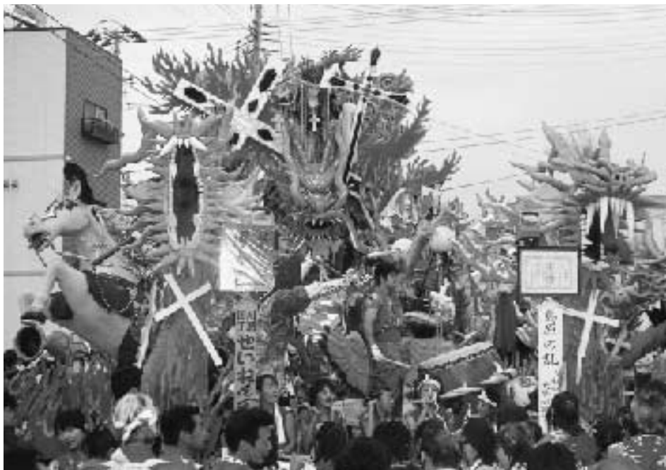
◀ 優秀賞 川原町青年団「島原の乱 切りしたん 支丹天草伝説」