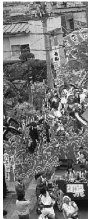
▼ 奨励賞 蛭川学区自治会「義