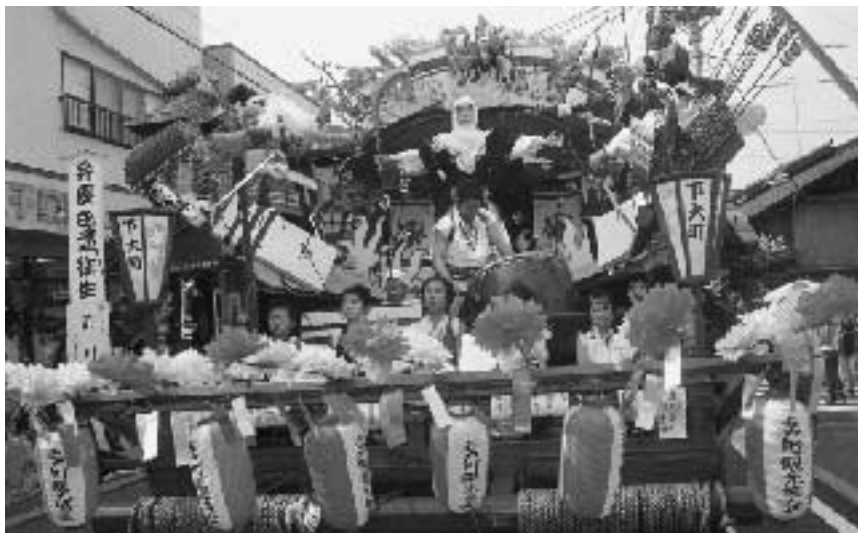
▲ 奨励賞 下大町自治会「弁慶の立往生」