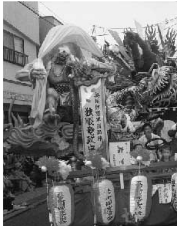
▲ 最優秀賞 (山車部門最優秀賞 運行部門最優秀賞)