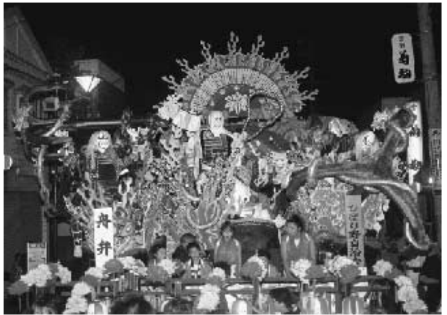
▲ 特別賞 ひばり野自治会「船弁慶」