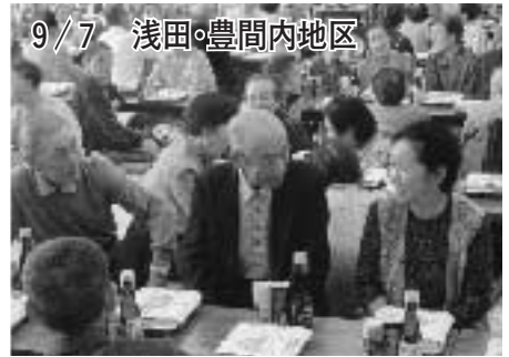
9/7 浅田・豊間内地区 健康の秘けつは・・・笑顔