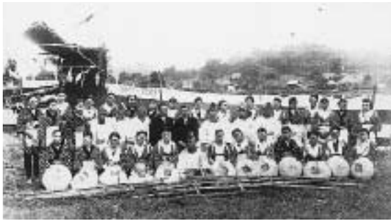
田植えの早乙女30人と関係者たち