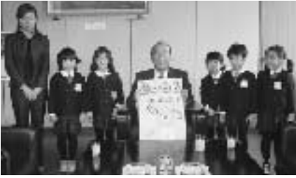
役場を訪れた江渡幼稚園の子どもたち

江渡幼稚園(江渡てる園長)の園児が勤労感謝の日になんで役場を訪れ、三浦正名町長に手作りの2006年用カレンダーをプレゼントしました。また、役場内を見学したり三浦町長に役場の仕事について質問したりして「働くこと」について学びました。