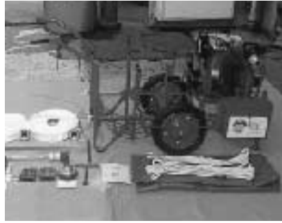
扇田婦人消防クラブに配備された軽可搬ポンプ

4日に発生した大規模林野火災を機に「自分たちの地域は自分たちで守る」という意識が高まっており、今回のポンプ配備によって一層の防火・防災活動の推進が図られるものと期待されています。