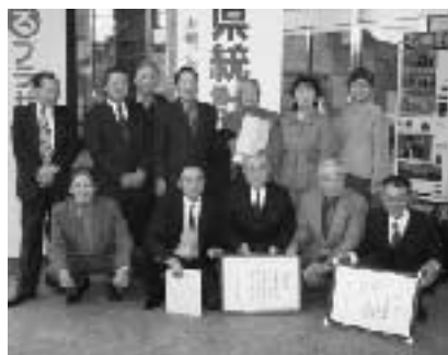
五戸町統計研究会の皆さん

第44回青森県統計大会において、五戸町統計研究会と会員4人が各種表彰を受賞しました。同研究会は、円滑な統計調査活動の遂行と統計思想の普及発展のために組織されたもので、今年で設立50周年を迎えました。