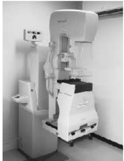
町健診センターに導入されたマンモグラフィ