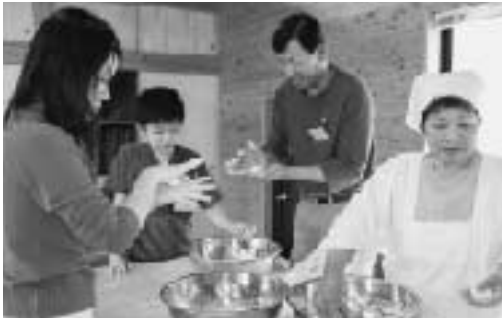
なべっこ団子作りに挑戦する一行

同校との交流は、旧倉石村が平成12年にシンガポールへの中学生海外派遣を開始して以来続いています。今回の訪問では、倉石地区の「ふるさとの味伝承館」でそば打ちや郷土料理作りに挑戦。また、今年1月にシンガポールを訪