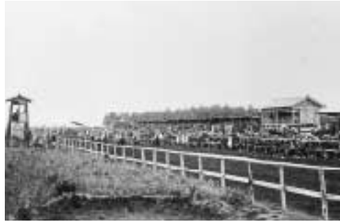
大正時代に競馬が行われた白山岱の広場

大正四年七月二十四日と二十五日にも私設競馬と自転車競走会が開かれた。二十四日は雨天のため競馬は三回、自転車は一回だけで中止された。受賞は次のとおり。