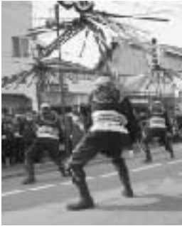
勇壮なまとい振り