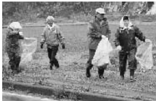
道路のごみを拾う参加者

今年で14回目となるごみ0運動が4月19日に行われました。各自治会では早朝から町民が繰り出し、道路に落ちていた空き缶やビニール袋などのごみを拾いました。今回集められたごみは可燃ごみ4.5トン、不燃ごみ3.0トンの計7.5トン。町職員によって回収、十和田地域広域事務組合のごみ処理施設に搬入され処分されました。