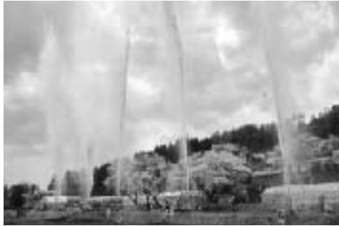
恒例の玉落し大会

その後、五戸高校東側の用水路沿いに会場を移して呼び物の「玉落し大会」が行われました。会場では高さ9メートルの柱の先に結び付けられた玉をめぐけて下から放水する団員らに、大勢の観客から声援が送られていました。