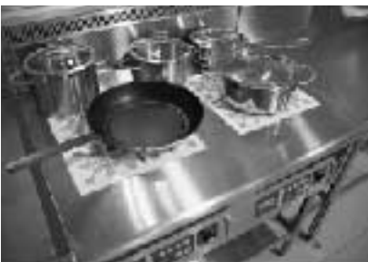
IHクッキングヒーター用鍋セット