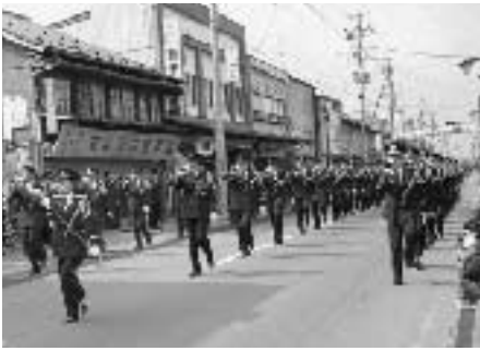
堂々の行進（ラッパ隊）

引き続き五戸小学校で行われた式典では、永年勤続者や功労者などに表彰状が贈呈されました。また、式典終了後には、ポンプ操法や小隊訓練が行われたほか、女性団員に