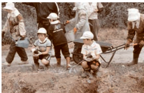
● 6月18日 大きく咲け、ひまわりの花

選手たちは「五戸町に再び活気あるサッカーを呼び戻そう！」と三浦町長から激励された。