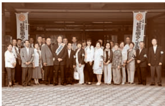
● 7月5日 社会を明るくする運動