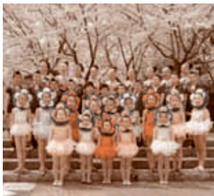
バトンチーム「アリエス」