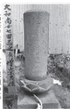
高雲寺住職 大竹保順の墓

星」を創刊。41年の百号まで続けて廃刊（鉄幹34歳の時）。その後、復刊を夢見て色紙や短冊を書く鉄幹であった。