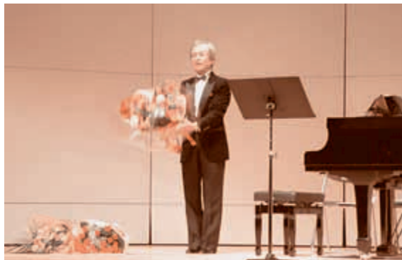
● 6月23日 町民いこいの日「町民いこいの日」

石沢小学校で行われた参観日に、5学年では「思春期教室」が開かれた。授業を受ける児童のほか、参観しに来校した父母を交えて、妊婦体験をするなど、命の尊さについて学んだ。また、わが子誕生の感激を綴ったお母さんの手紙を、子どもたちは照れながら読んでいた。