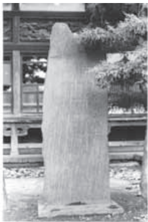
五戸の文学碑第1号 太田祖海の句碑（高雲寺本堂入口）

星」を創刊。41年の百号まで続けて廃刊（鉄幹34歳の時）。その後、復刊を夢見て色紙や短冊を書く鉄幹であった。