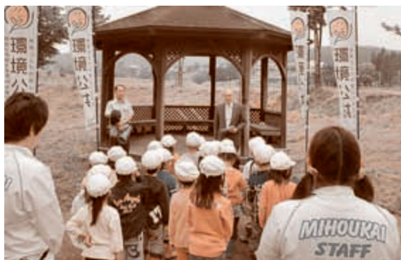
● 7月4日 五戸川に稚魚を放流