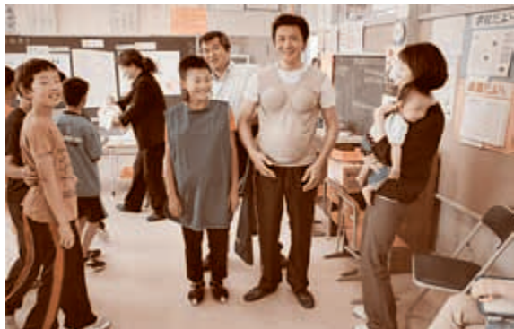
● 7月3日 石沢小学校「思春期教室」