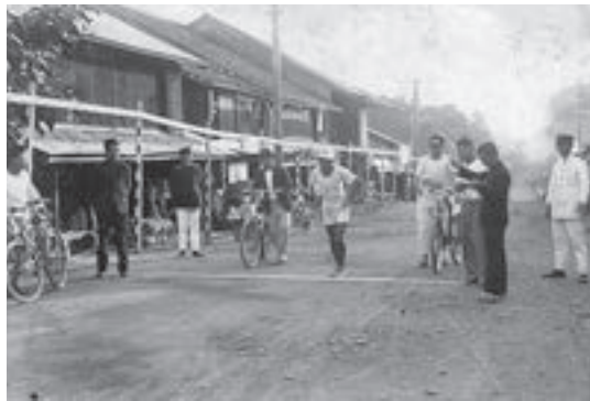
昭和初期の駅伝（上大町の道路）

百年以上前から五戸では体力づくりの一環として子どもや若者にマラソン・駅伝に参加させ、強力な健康づくりに力を入れた。