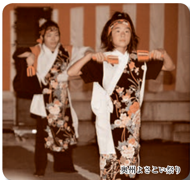
奥州よさこい祭り