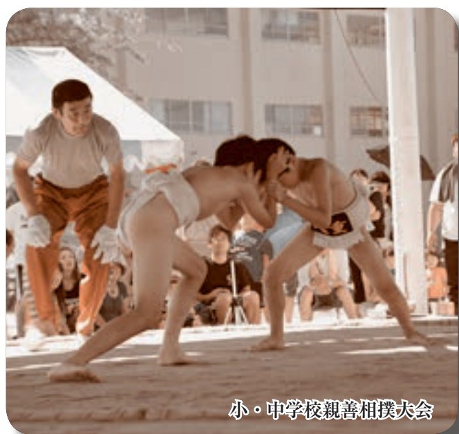
小・中学校親善相撲大会