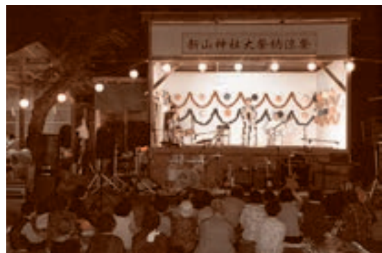
● 8月18～19日 倉石各地区でお祭り 石沢・中市・又重