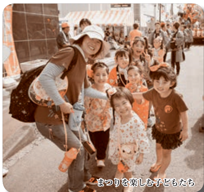
まつりを楽しむ子どもたち