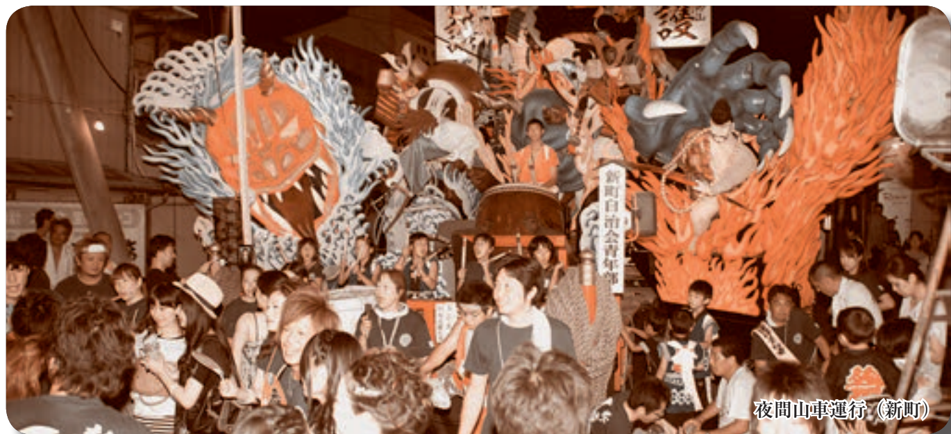
夜間山車運行 (新町)