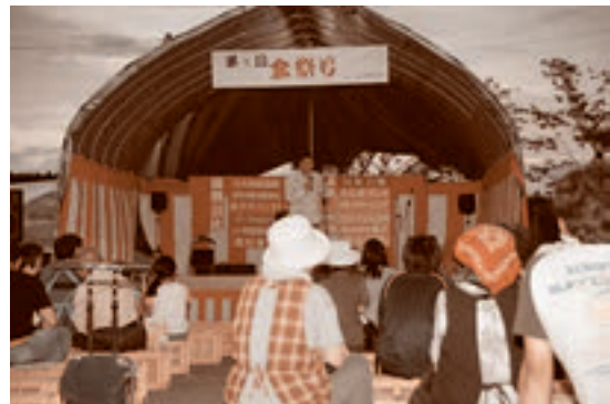
● 8月16日 佐野自治会、夏祭り 第9回盆祭り