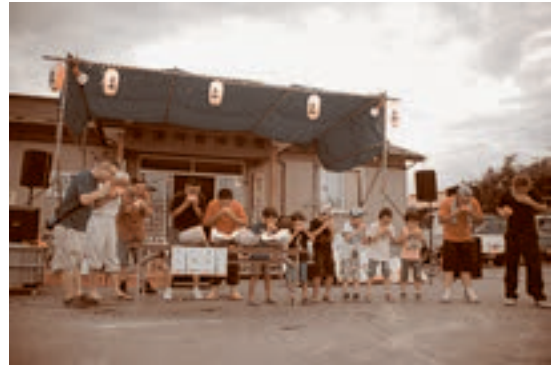
● 8月15日 菖蒲川自治会館でお祭り しよんぷかまつり