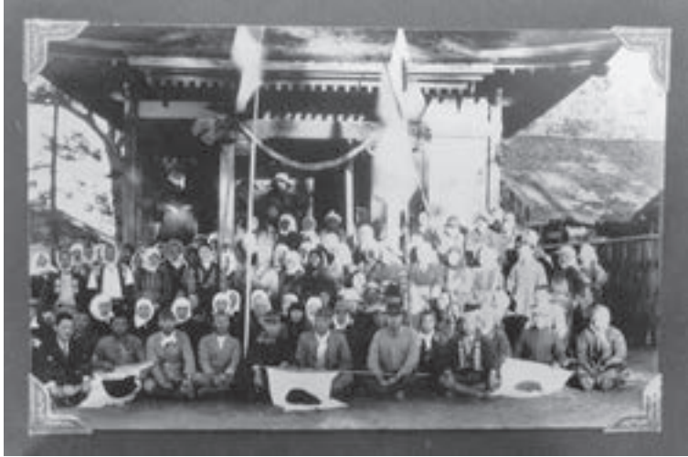
川原町出征兵士の家族に田植奉仕をする農民（著前様 昭和13年5月5日）

このほか、人手不足の農家に対して、畑の草取り、牛馬の草刈りの手伝いもあった。仕事の終わりに、戦地に居る夫や息子に写真を写して、古里の便り