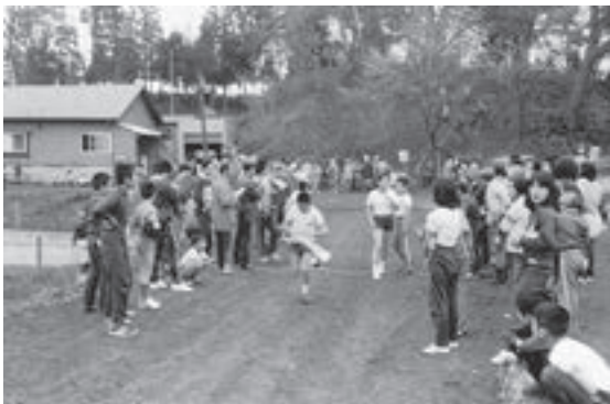
上市川の桜沼駅伝

その少年が今の4・50代にあたり、存在する町民が町民運動会で大活躍の土台になっているようだと言っていた。