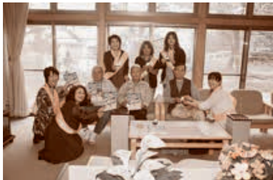
●五戸町交通安全母の会、高齢者に呼びかけ 10月5日 交通安全高齢者訪問事業

青森県トラック協会三八支部青年部会では、毎年地域の安全に貢献するため、ストップマークの寄贈を行っている。今年も五戸警察署署長室で、五戸町交通安全母の会が寄贈を受けた。このストップマークは地域児童の交通安全のために交通安全母の会の手で設置される。