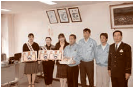
●ストップマークを寄贈 10月9日 トラック協会よりストップマーク寄贈

青森県トラック協会三八支部青年部会では、毎年地域の安全に貢献するため、ストップマークの寄贈を行っている。今年も五戸警察署署長室で、五戸町交通安全母の会が寄贈を受けた。このストップマークは地域児童の交通安全のために交通安全母の会の手で設置される。