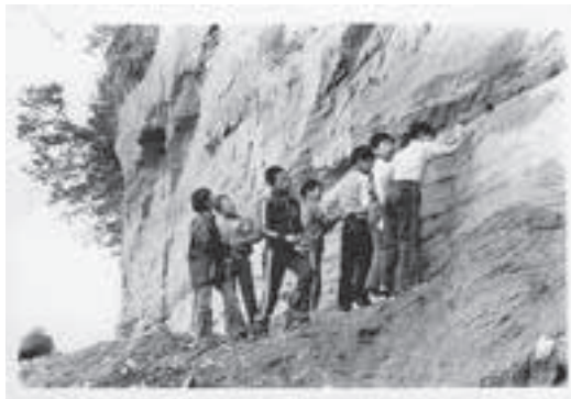
高学年の子どもたちは貝殻を掘り当て大喜び（昭和25年ごろ）