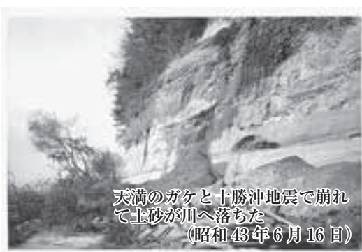
天満のガケと十勝沖地震で崩れて土砂が川へ落ちた（昭和43年6月16日）

昭和43年6月16日の十勝沖地震ではガケ崩れがおおきく五戸川に土砂が流出、改修後はガケにコンクリートを散