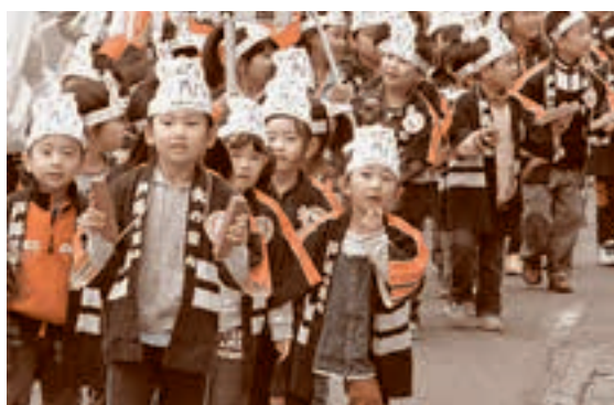
●「小さな火消し」の大パレード!! 10月17日 五戸地区幼年消防クラブ防火パレード

功績が認められたのは、地元食材の使用など児童が食の大切さを理解できるような食育に力を入れてきた結果。