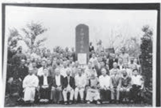
星野先生の景仰碑と除幕式の出席者