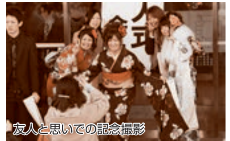
友人と思いでの記念撮影