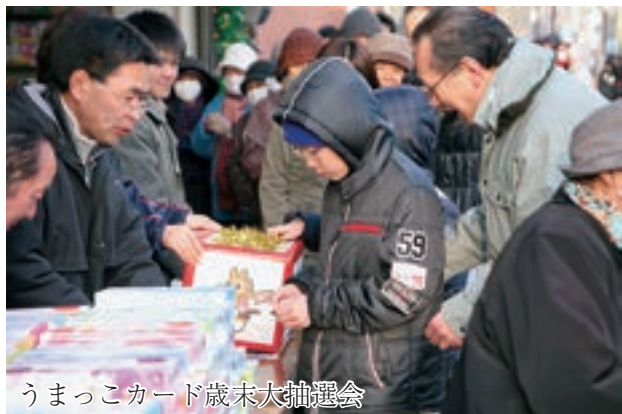
うまっこカード歳末大抽選会

中心商店街で12月23日、クリスマスイベント「五戸でスマス X'mas」が開催されました。歩行者天国となった会場では、五戸町共通ポイントカード「うまっこカード」の歳末大抽選会などが繰り広げられました。抽選会は、東京ディズニーランド旅行チケットなど豪華賞品が当たるとあって家族連れら大勢の町民で賑わいました。