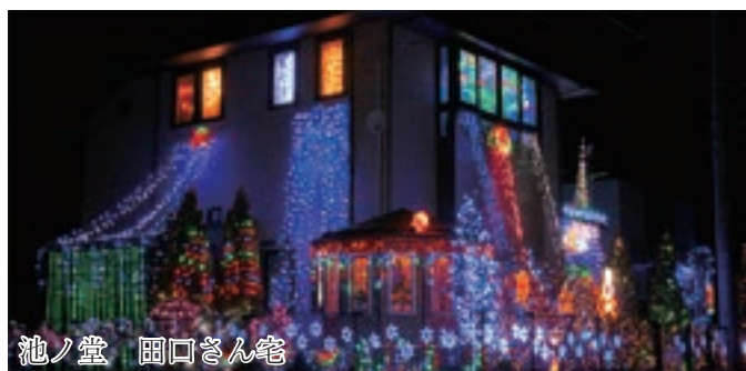
池ノ堂 圃口さん宅