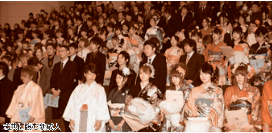
式典に臨む新成人

平成25年五戸町成人式が1月13日、町立公民館で開催されました。対象者239人のうち172人が参加し、社会人としての第一歩を刻みました。町では平成12年度から、新成人たちが自ら実行委員として、式を企画運営する形をとっています。今回は次の15人が実行委員を務めました。