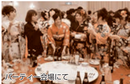
パーティー会場にて