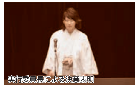
実行委員長による決意表明