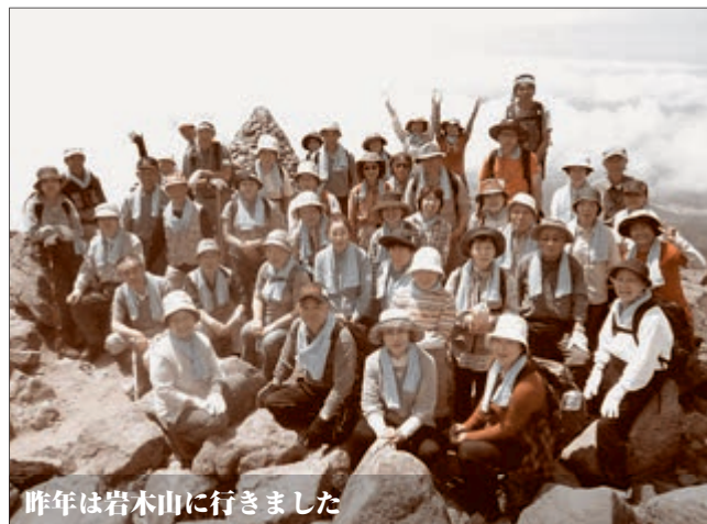
昨年は岩木山に行きました