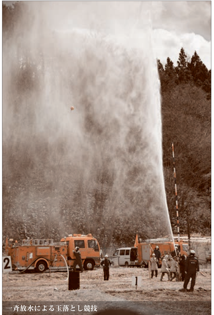
一斉放水による玉落とし競技