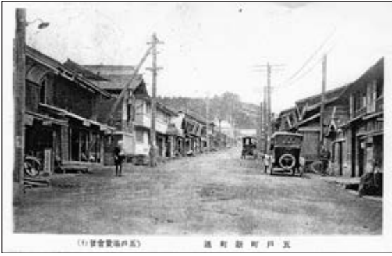
(五戸町新町通り) 五戸町新町通り

大正2年11月21日、上大町稲荷神社近くから出火し、下大町、横丁、博労町、新町の一部を合わせて168戸が全焼する火災が発生した。焼野原となった五戸町はその後、各地からの援助もあった。写真「五戸町新町通り」