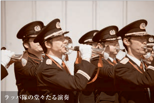
ラッパ隊の堂々たる演奏