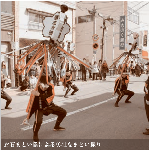
倉石まとい隊による勇壮なまとい振り