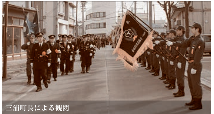
三浦町長による観閲

その後、五戸小学校北側の用水路沿いに会場を移して恒例の「玉落とし大会」が行われ、会場を賑わせました。 団員らは玉を入れたドラム缶めがけて放水し、水を溜め玉を外に出すと、高さ9メートルの柱の先に結び付けられた玉をめがけて下から一斉に放水し、一面を水壁で飾り、大勢の観客から声援を受け競い合いました。