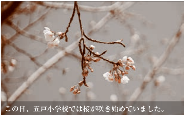
この日、五戸小学校では桜が咲き始めていました。