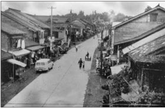
【写真】昭和中期の新町通り(初めて舗装道路になった頃)