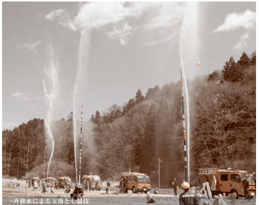
一斉放水による玉落とし競技

引き続き五戸小学校を会場にして行われた式典では、永年勤続者や功労者などに表彰状が贈呈されました。 その後、五戸小学校北側の用水路沿いに会場を移して恒例の「玉落とし大会」が行われ、会場を賑わせました。 団員らは玉を入れたドラム缶めがけて放水。水を溜め、玉を外に出すと、こんどは、高さ9メートルの柱の先に結び付けられた玉をめがけて下から一斉に放水。一面を水壁で飾り、大勢の観客から声援を受け競い合いました。