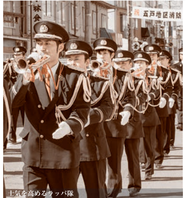
士気を高めるラッパ隊