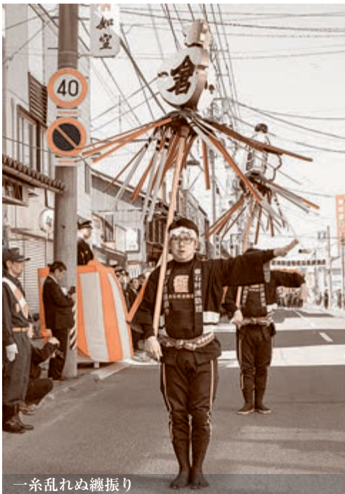
一条乱れぬ纏振り