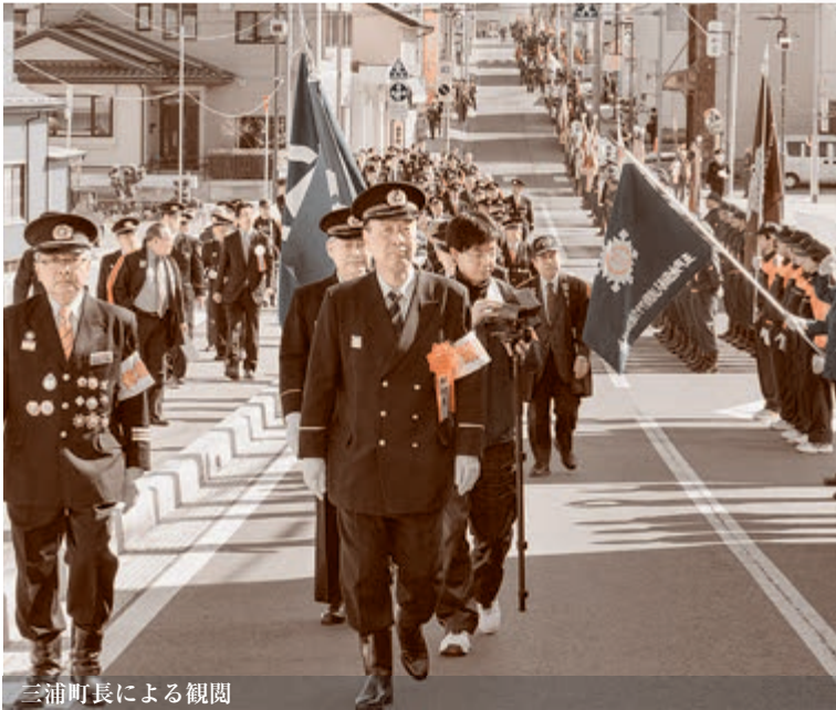
三浦町長による観閲