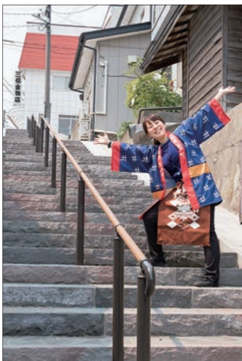
新しく舗装された西塔坂と一緒に

袖の後ろ側には青森県の地 図が描かれていて、袖を見せ ながら相手に五戸町の場所を 教えられるようになっていま す。はつぴも前掛けも、コミュ ニケーションの道具。このア イテムを使って、五戸町に興 味を持ってもらいたいと思 います。