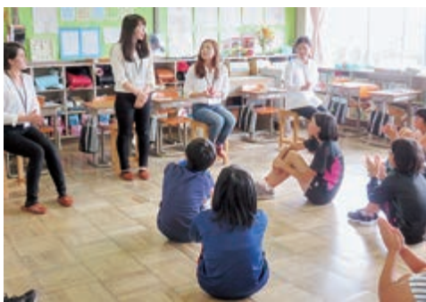
小学生と交流する台湾大学生4人

緒に参加。英語で自己紹介やゲームをしたり、児童からの台湾の生活についての質問に答えてもらいました。児童のみなさんや先生方に温かく歓迎していただき、緊張していた大学生達もすぐに笑顔になり交流を楽しんでいました。