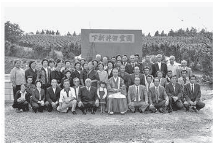
下新井田霊園完成記念 S57.9.19

そこで移転手続きのため、2〜3代前からの戸籍謄本が必要となり県内外からの書類が必要となるなど、半年以上もかかり再発行にこぎつけた。