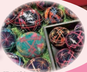
「Hidamari Pony」※数に限りがあります。