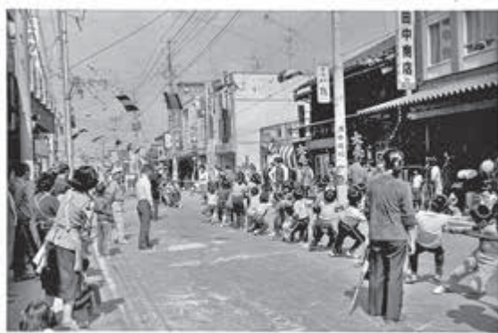
【写真】（昭和57年5月3日）下大町商店街の歩行者天国で綱引きが行われている様子

また、花見会場は八幡宮から新町の館場公園、地蔵平と移っていくようになった。（現在は五戸町観光協会主催の五戸春まつりが図書館前広場にて開催されている。）