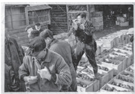
【写真】昭和26〜27年ごろの浅水のセリ市風景

浅水出品の紅玉が農林大臣賞となった。続く昭和28年にはリングゴ貯金が350万円に達し大蔵大臣賞を受賞。組合員は大きな賞を受賞したことに大いに驚くとともに大変喜んだ。