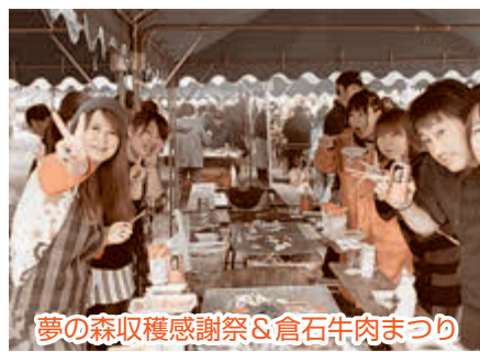
夢の森収穫感謝祭&倉石牛肉まつり