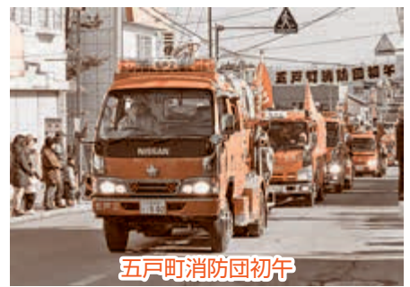
五戸町消防団初午