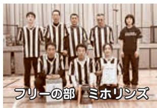
フリーの部 ミホリンズ

ソフトバレーボールは、バレーボールに比べ、ネットが低く、ボールも柔らかいため、突き指などの危険も少なく、誰もが安心して気軽に楽しめるスポーツです。友人、職場、そして家族などでチームを作り、来年度も是非、ご参加ください。