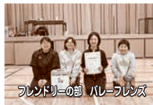
フレンドリーの部 バレーフレンズ