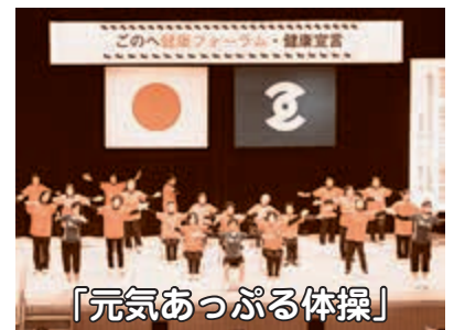
「元気あっがる体操」

五戸町では、このへ健康フォーラム・健康宣言を平成29年11月23日に行いました。町民の取り組み目標とし「健康への五つの戸(と)」を掲げ、「健やかでこころ豊かな五戸町」を目指すことを宣言しました。五つの戸の中の一つとして運動があります。「めんどくさい」「時間がない」を言い訳せず、生活の中でちょこまか動き、1日8,000歩を目標に、体を動かす時間を10分増やし生活習慣の改善につなげる扉を開きましょう。