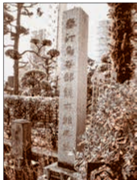
【写真】吉祥寺鳥谷部春汀之墓