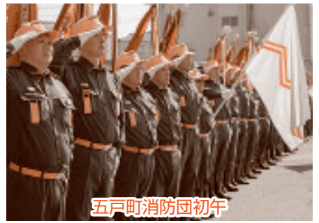
五戸町消防団初午