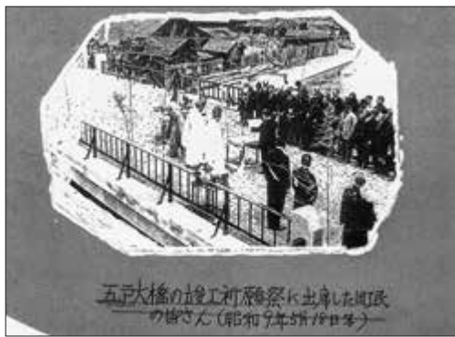
【写真】五戸大橋の祈願祭に出席した町民の皆さん（昭和9年5月18日）

昭和9年5月18日午前10時、橋の中央に祭壇を作り、安全祈願をしたあと渡初式（わたりぞめ）が行われた。下新井田と兎内の夫婦3組が先頭になり渡った。続いて町