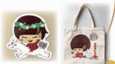
五戸町観光協会 ☎ 62 - 7155

五戸町観光協会では、おんこちゃんのイラストが付いたトートバッグ（Mサイズ）やカーマグネット等を販売しています。今後は缶バッジ、ポストカード、ボールペン等も販売予定です。