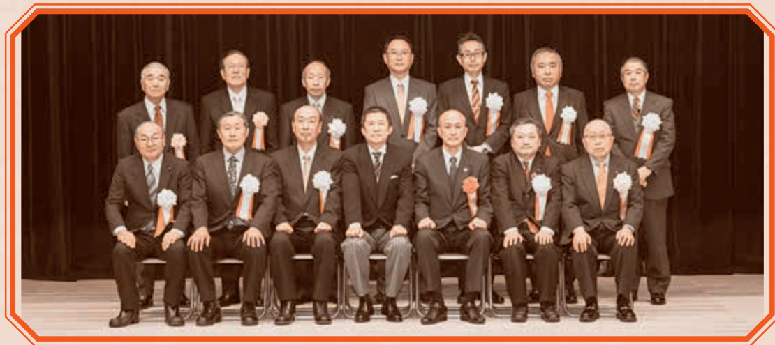
受章者の皆さん、おめでとうございます。