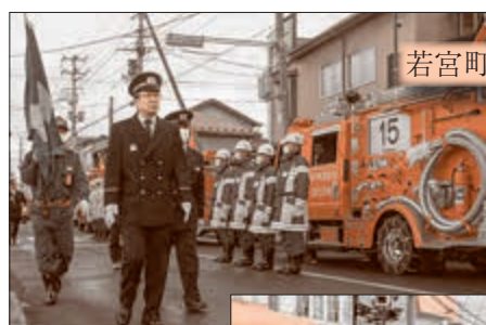
若宮町長による観閲