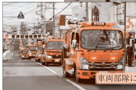
車両部隊による分列行進