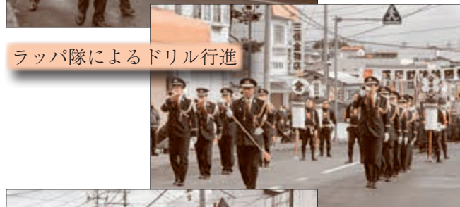
ラッパ隊によるドリル行進