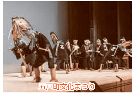
五戸町文化まつり