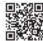
五戸町ホームページ

詳細については、広報このへまち6月号をご覧になるか五戸町ホームページ「五戸町奨学生追加募集」のページをご確認ください。