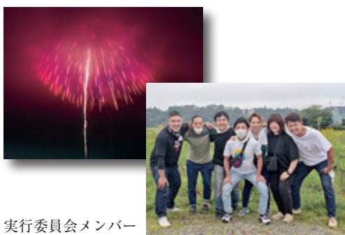
実行委員会メンバー

当日は打ち上げ直前に雲がかかり、大輪の花を咲かせることはできなかったが、明るく色づく夜空に響き渡る音が私たちに十分すぎる夏を感じさせてくれた。