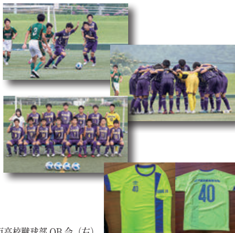
五戸高校蹴球部OB会(右) 五戸サッカー協会(左)からの寄付により新調した練習着