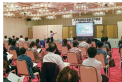
【前回の講習会の様子】