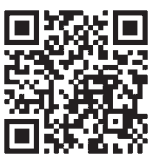
五戸町ホームページ

「あomorアピリンピック」は、障がいのある方々が日頃培った技能を競う大会です。参加方法などの詳細については五戸町ホームページをご確認ください。