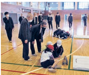
五戸小学校では、マット運動のお手本動画を確認しながら技に挑戦

GIGAスクール構想とは、児童・生徒向けに1人1台の端末と、学校施設に高速大容量の通信ネットワークを一体的に整備し、多様な子どもたちを誰一人取り残すことなく、公正に個別最適化された教育を実現させる構想のことで、五戸小学校と五戸中学校を訪問し、授業での活用方法等を調査した。