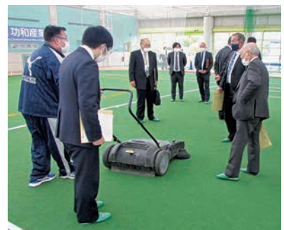
人工芝の手入れの方法について五戸町スポーツ振興公社職員から説明を受けた

また、擦り傷の抑制や足腰への負担軽減のため、国内初の「珪砂入り高密度人工芝」を導入し、多目的に応用できるようになっている。