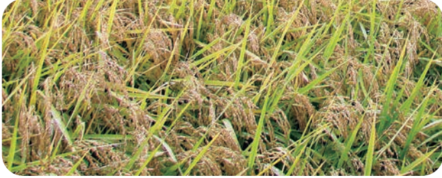
コロナ禍の影響で米価が下落し、稲作農家の経営は厳しさを増している