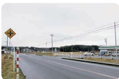
産直施設整備候補地の県道20号線周辺

スマート農業に必要な機械等の導入に対しては国の補助制度がある。また、高収益作物への転換や低コスト省力技術の導入に対しては県で支援することとなっている。