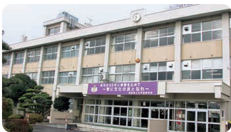
93年の長い歴史に幕を閉じる五戸高校

今後は大規模な造成を考えず、時期をずらしながら小規模な造成を行うことよって対処できると考えている。