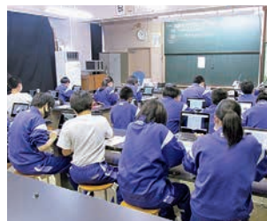
五戸中学校では、理科の授業の中で光の進み方についての研究に活用