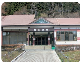
休業状態となっている倉石温泉

土砂災害については、土石流や急傾斜地の崩壊のおそれがあるが、土砂流出による被害を防ぐため、平成11年度復旧治山事業により、県で整備したコンクリート谷止工を県と町とで調査したところ、現在でもその機能を十分に果たしていることを確認した。 また、洪水及び浸水に