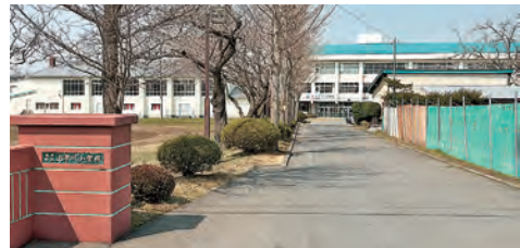
現・上市川小学校を改修して川内小学校が令和9年度に開校