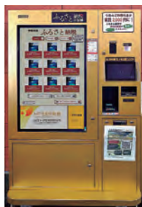
ふるさと納税自販機のイメージ

で購入して使えるというもの。現段階で考えている返礼品は、飲食店で使える食事利用券、温泉の入浴回数券がある。この自販機本体及び設置の業務委託料として計上した。