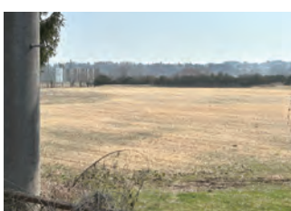
旧五戸高校野球場跡地に人工芝の多目的グラウンドを整備

開校前の完成を目指し、総事業費は3億7730万円(税込)。様々な助成を申請している中、五戸町の負担は2億6930万円の試算である。