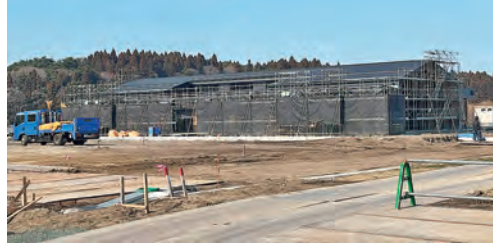
バ・オールは今年の8月にオープン予定