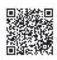
ごみ収集アプリ Android用