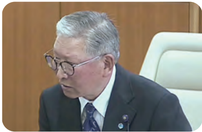
とよ たか お 議員 豊田 孝夫