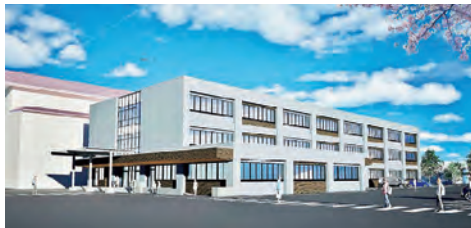
令和11年度開校予定の五戸中学校新校舎の完成イメージ