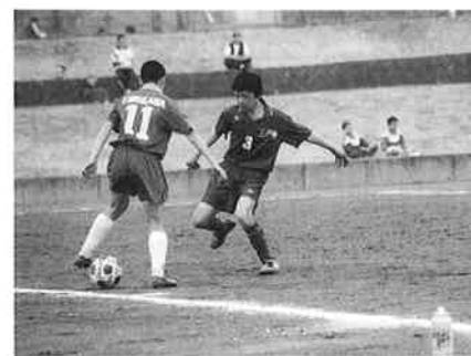
マツオスポーツ杯中学校サッカー大会