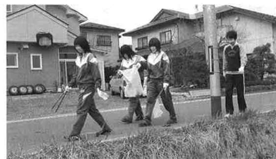
五戸高校生も運動に参加