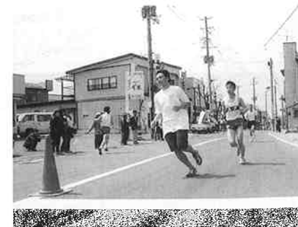
五戸地方マラソン大会