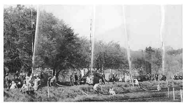
大勢の観客の中での玉落とし大会

また午後からは五戸高校東側の用水路沿いで、恒例の「玉落とし大会」が行われ、総指揮官の合図により高さ9mの柱の先端に取り付けられた玉をめぐり一斉に放水。悪戦苦闘しながらも青空に突き刺すかのような水の矢で玉を落とし、大勢の観客から盛んな拍手を受けていました。