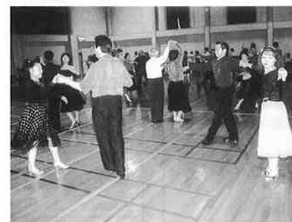
チャリティダンスパーティー