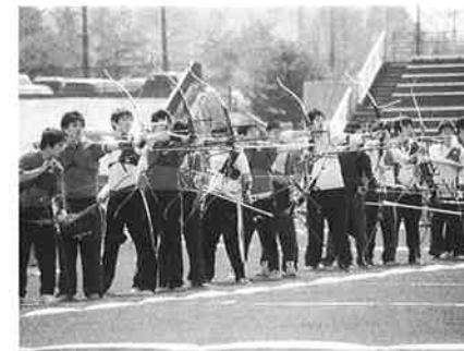
青森県春季アーチェリー大会