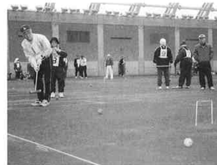
五戸地方親善ゲートボール大会