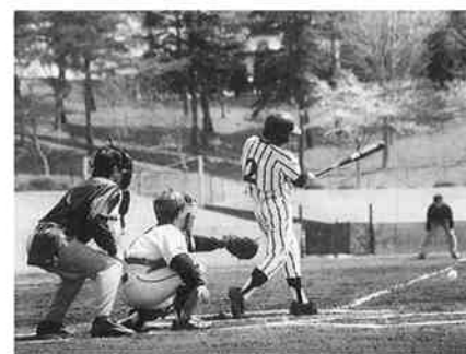
三戸郡中学校春季野球選手権大会