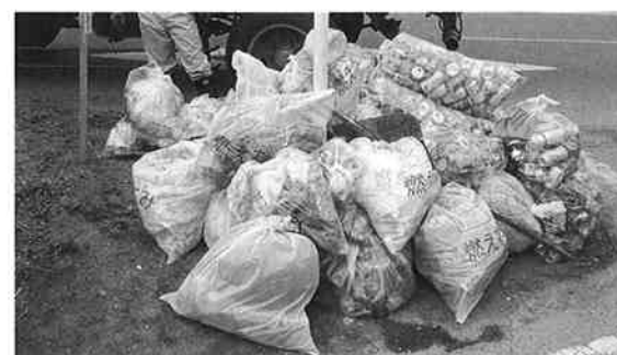
各地区で集められたゴミ

町と自治会が一体となった全町一斉のゴミ0運動が4月19日の早朝に行われ、昨年より1t少ない7.5t(可燃ゴミ3.5t、不燃ゴミ3.6t、粗大ゴミ400kg)のゴミを拾い集めました。ゴミ0運動は毎年行われており今年で9回目。当日は午前6時30分から、各自治会で集まり作業を開始。町内ごとに決められた場所へ収集しま