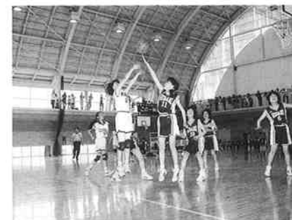
五戸地方ミニバスケットボール大会