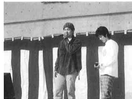
唄と踊りの競演会

●皆さんの作品を「文芸このへ」に発表してみませんか。 川柳・短歌などの区別を明記し、総務課広報係へ。 お待ちしております。