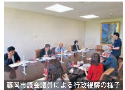
藤岡市議会議員による行政視察の様子

また、7月11日（月）に群馬県藤岡市議会から4名が「五戸みらいサロン」の行政視察に来庁しました。町内外から参加者がいるだけでなく、県外からも注目されている取組です。ぜひお気軽にご参加ください。