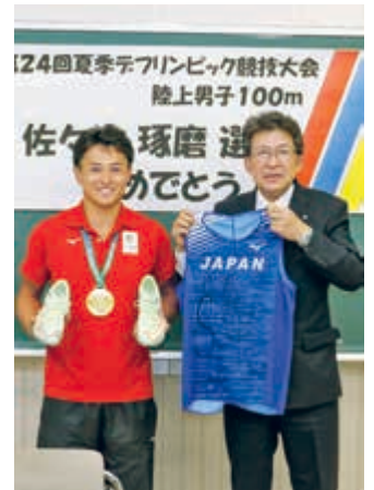
寄贈されたサイン入りユニフォーム