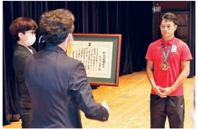
若宮町長は表彰状の内容を手話で伝えました

五戸ちゃんねるでは、式典や講演会、陸上教室の様子をまとめた動画を近日放送予定です。お楽しみに！