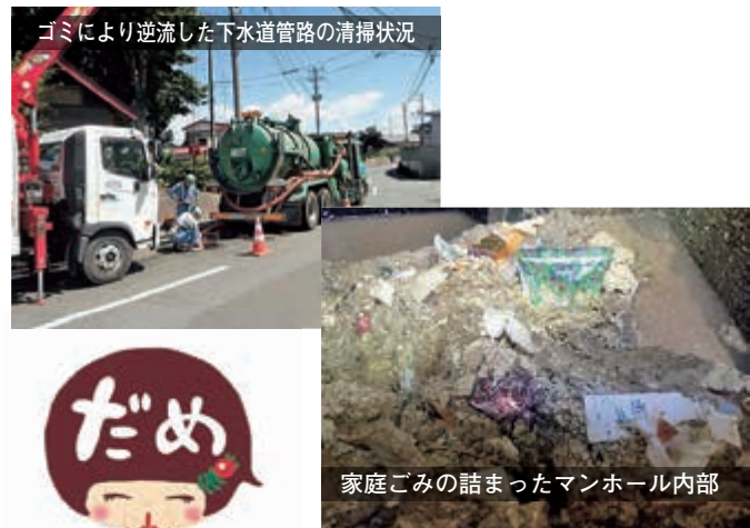
ゴミにより逆流した下水道管路の清掃状況

なお、家庭ごみ等異物の投棄により下水道本管を詰まらせる行為は、下流の方に迷惑をかけるだけでなく、下水道法第44条の規定（施設の機能に障害を与えて下水の排除を妨害したもの）により 罰せられる恐れ がありますので、 けっして流さないよう お願いいたします。