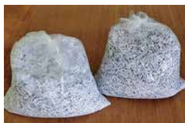
使用できるごみ袋