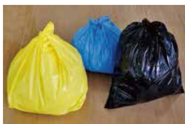
使用できないごみ袋