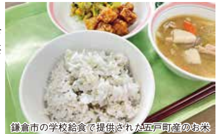
鎌倉市の学校給食で提供された五戸町産のお米