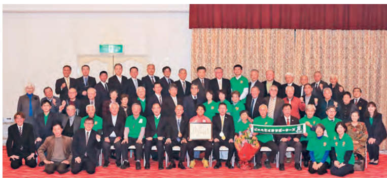
「健闘を称える会」出席者との記念撮影