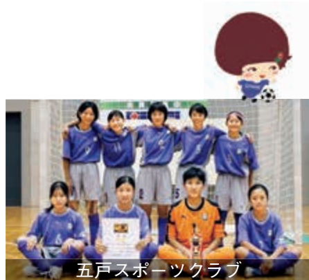
五戸スポーツクラブ