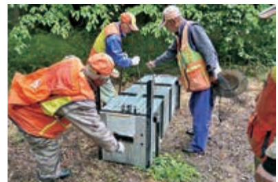
猟友会の活動の様子