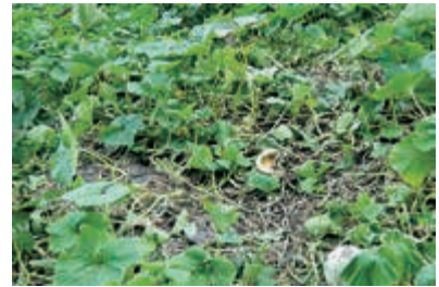
食い荒らされたかぼちゃ

町民皆さんの協力が不可欠です。今後は鳥獣被害対策の説明会を開催するなどして鳥獣の特徴や習慣などをみんなで勉強し把握してから対策を練れるように努めて参ります。