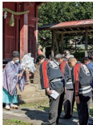
稲荷神社での神事の様子