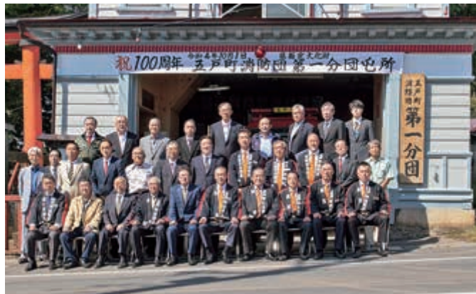
100周年を迎えた屯所と五戸町消防団の方々

今月号の広報ごのへまちの表紙は、この行事のうち、稲荷神社内で行われた祝賀放水の様子を撮影したものです。