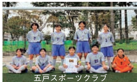
五戸スポーツクラブ