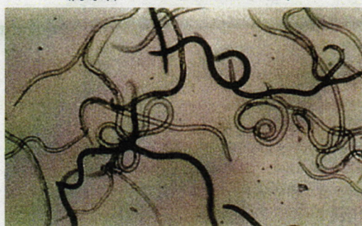
病原体マツノザイセンチュウ