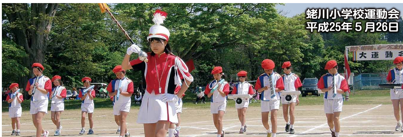
蛭川小学校運動会 平成25年5月26日