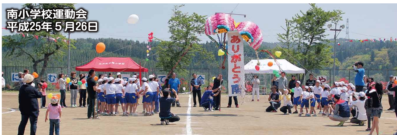
南小学校運動会 平成25年5月26日