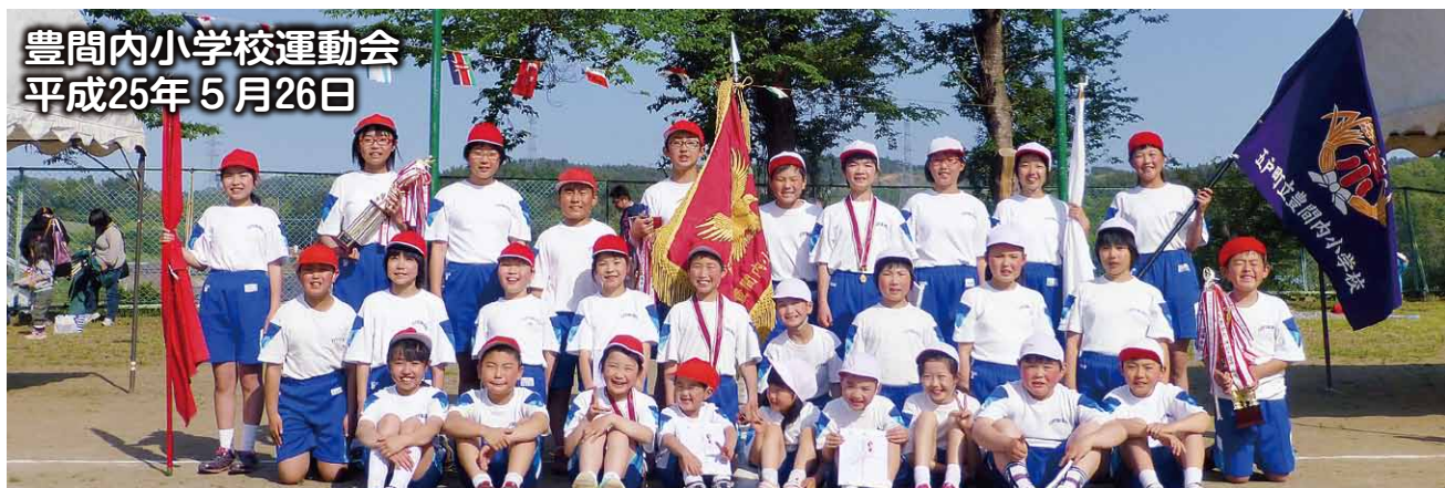
豊間内小学校運動会 平成25年5月26日