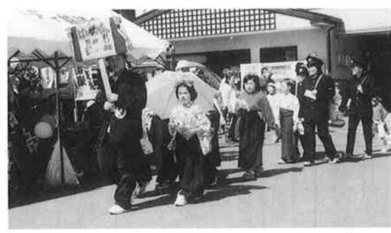
小学生による「はいからさんがとる」

列では、地元婦人会員や小学生など7団体が参加。会場から着物や学生服姿に大きな拍手がわいていました。 また、高山展望台では昔の玩具工作教室などが開かれ、参加者は竹笛や豆鉄砲を作りながら、自然と文化遺産を満喫しました。