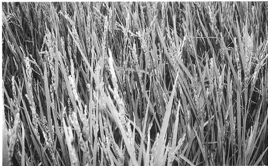
水田の7割で発生した「いもち病」

今年6月下旬以降の連続した異常低温と極端な日照不足により、水稲に不稔障害や生育の遅れが見られるなど、農作物全般にわたって品質の低下や収穫量の大幅な減収が確実となり、経済に与える影響が深刻な事態となっています。このため、町では農家の生活安定と再生産の確保を図られるよう、青森県・農業団体などとの連携のもとに緊急対策を講じるため、10月6日に五戸町農作物異常気象災害対策本部を設置しました。