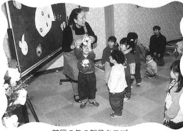
前回の冬の親子クラブ