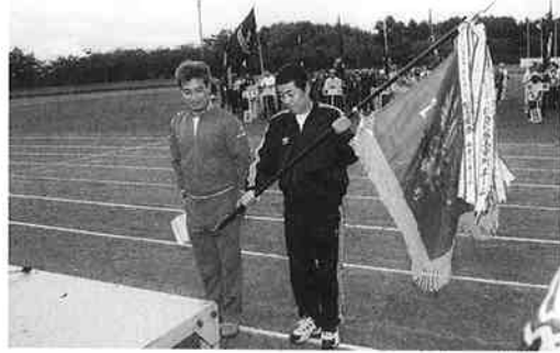
町長旗を受ける上市川チーム