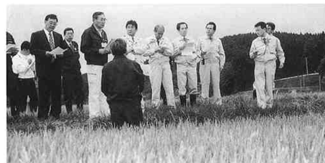
県議会冷災害対策特別委員会が被害状況を視察（根前地区）

今年6月下旬以降の連続した異常低温と極端な日照不足により、水稲に不稔障害や生育の遅れが見られるなど、農作物全般にわたって品質の低下や収穫量の大幅な減収が確実となり、経済に与える影響が深刻な事態となっています。このため、町では農家の生活安定と再生産の確保を図られるよう、青森県・農業団体などとの連携のもとに緊急対策を講じるため、10月6日に五戸町農作物異常気象災害対策本部を設置しました。