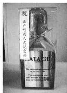
「HATACHI」のラベルを貼った記念品