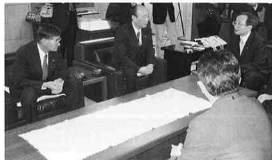
合併を申請し、三村知事と談話