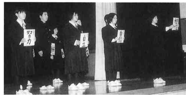
一人ひとりが決意を発表