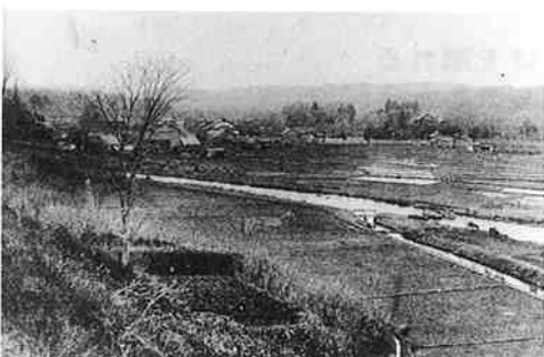
大正13年の天満下用水 (現五戸小の高台から)

五戸橋下流約200メートルに通称「五戸の筒口」がある。付近一帯は水の音で「ドウドオー」とうなっているように聞こえる。近くに高さ2メートルの竣工記念碑が建っている。筒口から水路が川内方面まで続く。天満下土地改良区の用水路と呼んでいる。慶長4年(1599年)、木村奎助(五戸代官)が五戸村古館の下川原から水を引き、兎内方面に引水したのがはじまりである。その後、水量が不足したので取水口を上流の天満下川原へ移した。