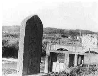
五戸川の頭首工と記念碑

明治4年以後、普通水利組合と改め、32年には天満下筒口普通水利組合が創立し、大正5年には頭首工に乱杭土俵止の施設が完成、コンクリート造りになった。昭和26年、土地改良法施行により「天満下土地改良区」となり、再三の改修を経て今日に至っている。