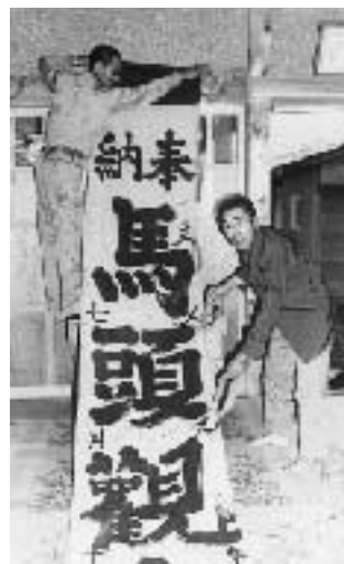
堂ヶ前の馬頭観世音ののぼり

馬頭観音は馬の墓とか馬の仏と考えられていたが、本当の名は馬頭観世音菩薩で馬の神様である。馬頭菩薩、馬頭大士、馬頭明王ともいって六観音の一つになっている。ヒンズー教の最高神の一つビシ