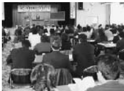
「全国子どもをほめよう研究会」東北大会には多数の町民や関係者が参加

前述の講演会では県選挙管理委員会の事業を、東北大会では社会教育振興財団の事業を上手に活用して講師料などを賄った。まずファイブドア