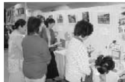
▲ 老若男女が投票したフォトコンテスト