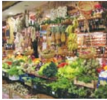
フィレンツェの朝市

この日はローマを離れて北上し、フィレンツェに向かいます。フィレンツェのサンタ・マリア・ノヴェツェラ駅に到着したのは10時半。大富豪メデイチ家の擁護によって発展したこの都市は、重々しい威厳に溢れていたローマとはまた少し雰囲気の違い、町全体に華やかさがあります。