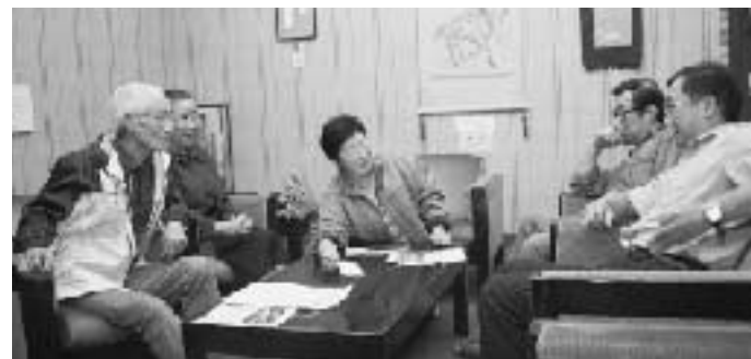
▲ メンバーが集うと「やりたいこと」の話題に花が咲く

る中、周囲から「きつと(作品が)集まらないよ」と言われることもあった。そこで明治の八景を巡るツアーや、奥州街道など町の名所での撮影会を発案。結果、118点が寄せられる盛況ぶりとなり、作品はすべて「五戸町産業と文化まつり」で展示した。