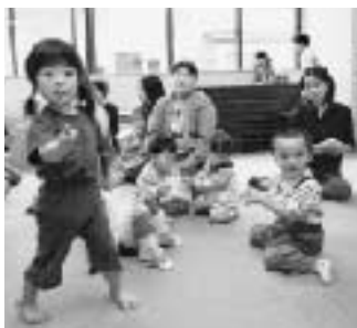
新たに立ち上げた子育てホットセンター

の企画ありきで、町はその企画に合うような事業がないかをアドバイスする。また、東北大会で壇上に飾った花は、卒業式シーズンだったので近くの小学校から借りるといったアイデア。