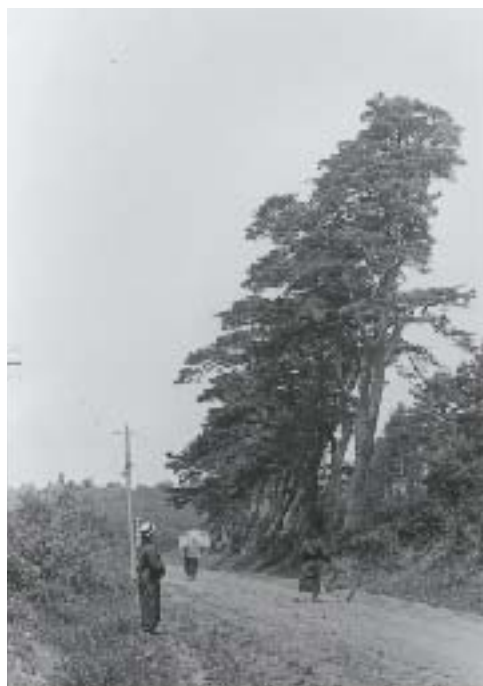
八幡坂から新道に出た大学坂境付近（大正末期）

坂を登りきった旧道一帯には、樹齢三百年以上の松並木が左右に並んでいたが、新道拡張のため一本だけ残して全