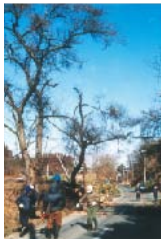
八幡坂の雑木清掃（平成9年3月）