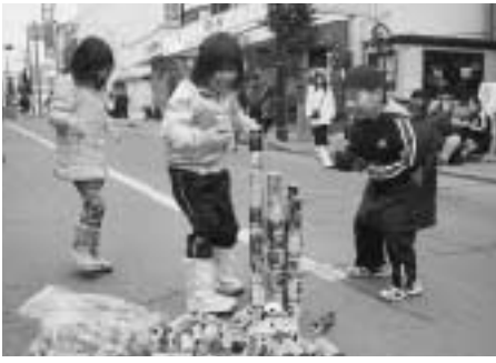
はらはらドキドキの空き缶積み上げ競争

当日はタウンズ・イルミネーションコンテスト'07の表彰式も行われました。入賞者は次のとおりです。(敬称略)