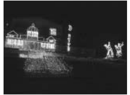
グッドタウン賞を受賞した山田自治会の作品