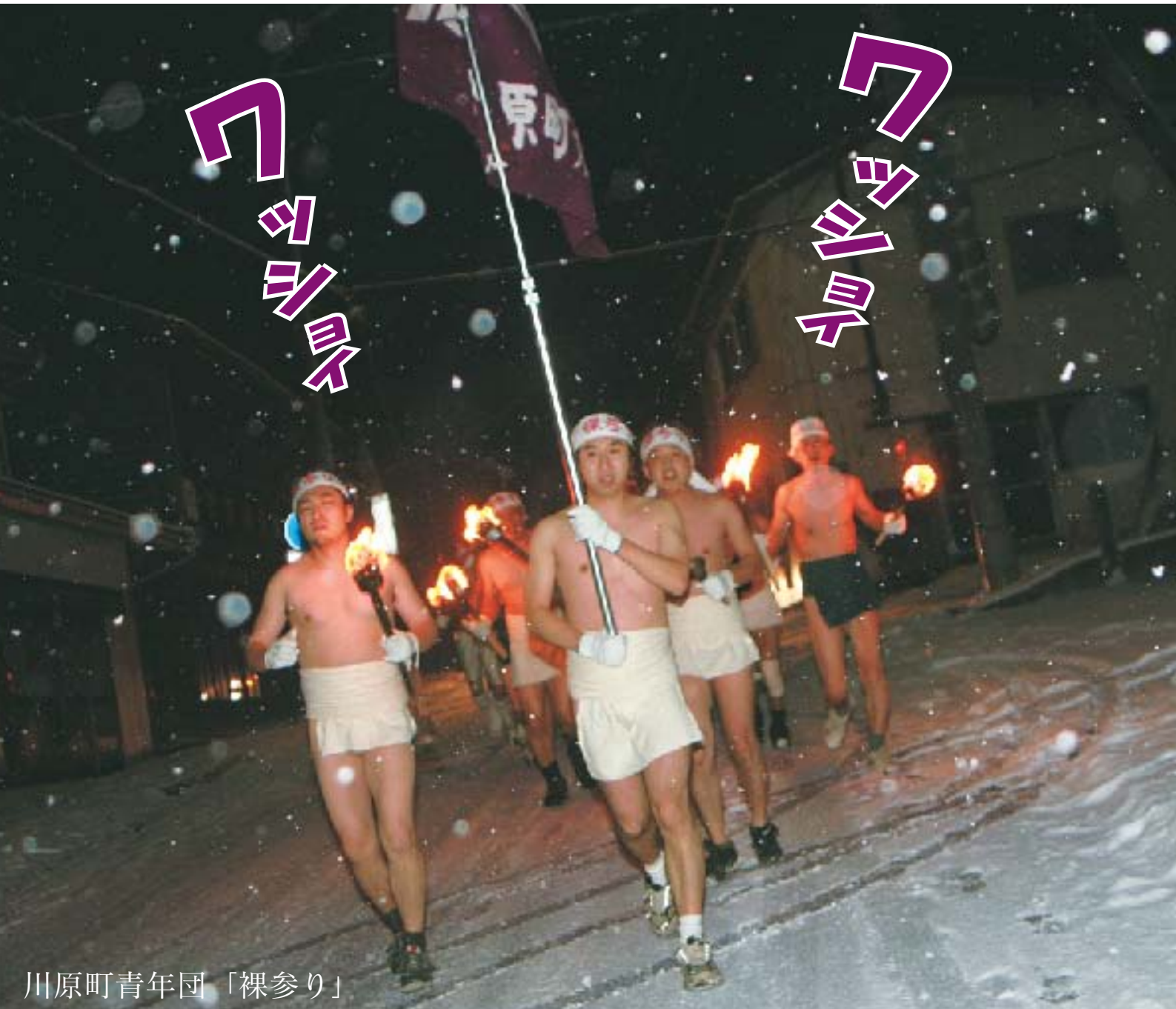
川原町青年団「裸参り」