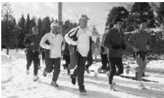
新春の風を切って走る参加者たち

当日は雪が少し積もってい たものの、さわやかな青空が 広がり、町内や近隣市町村か ら老若男女43人が参加。同公 園のジョギングコースを回 る2、3、5kmの各コースか ら自分に合うものを選び、思 い思いに「走り初め」を満喫 していました。