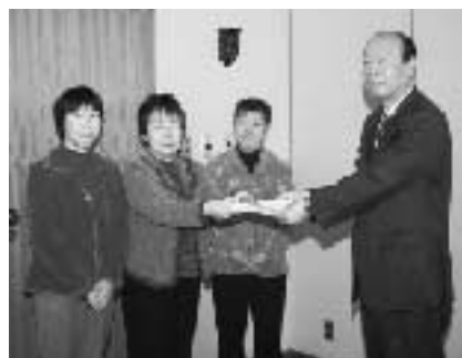
町長に目録を渡す「カマラードの家」の皆さん

同グループは平成9年12月に農家の主婦らで結成。地元産の材料にこだわり、健康補助食品「にんにくボール」や紅玉を使ったアップルパイなど数々の製品を開発し、まち