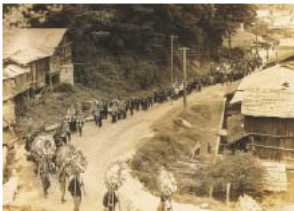
80年前の葬式行列。下町から西藤坂を登ってお寺に向かう

奥州街道を利用した西藤坂は新しい国道四号ができてから交通量が減り、町民の生活道路に変わった。この西藤坂を戦前から知る地元民は「昔