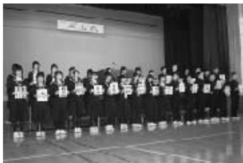
決意の言葉を掲げる倉石中の生徒たち

五戸、川内、倉石各中学校でこのほど、2年生202人が立志式に臨みました。立志式は武士の元服に由来する行事で、将来の志を立て大人としての自覚を持つのが目的です。