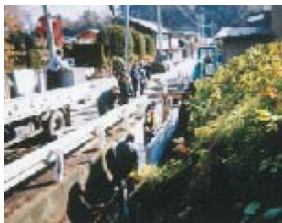
四ッ谷坂の側溝工事に奉仕した20人(平成8年11月10日)

を天覧された。田ノ草取りに参加した娘たちは「立派に完工した四ッ谷坂の蒼前神社境内で、村の方々からお礼の言葉と記念品が渡された」と息子や孫に口伝していた。