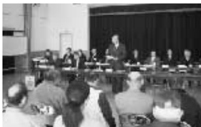
行政と住民が意見を交わした懇話会