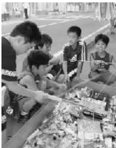
狙いを定め、景品ゲットか？