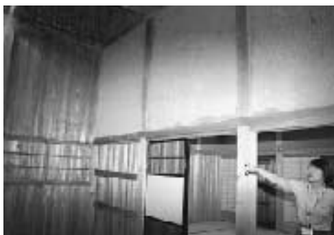
五戸代官所内部の土壁が崩落 ※写真上部