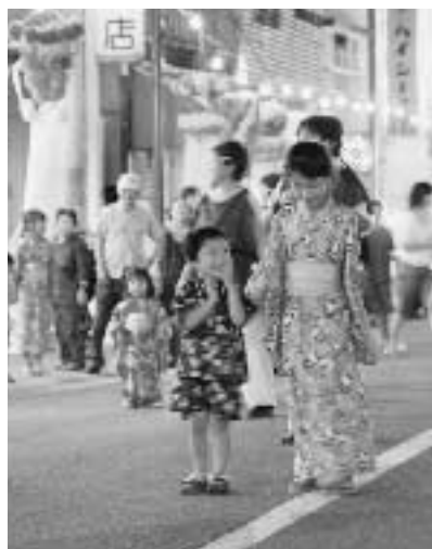
お姉ちゃん、楽しかったね！