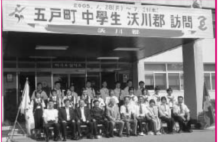
沃川郡庁を訪問した中学生18人。沃川郡守と一緒に記念撮影

また、韓国伝統文化体験では、沃川郡特産のぶどうエキスを使用した染め物と、祝い事に作られる伝統餅作りを体験しました。今回の交流事業によって「言葉は通じなくても心は通じる」という大切なことを学び、一回り大きく成長した彼らはとても目が輝いていました。彼らにとってこの貴重な経験は一生の宝物となったことでしょう。