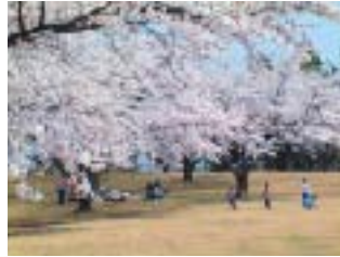
桜の名所「小渡平公園」

この公園の特徴は、桜が約五百本もありソメイヨシノ、八重桜が見客を喜ばせる。広さは十一畝もある。汗を流したら倉石温泉が又重の国道四五四号に面した所にある。