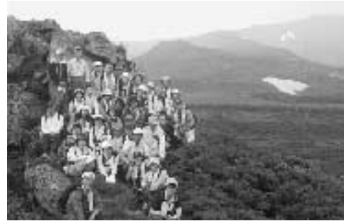
八幡平の山々をバックに記念写真

毎年恒例の町民登山が7月4日に開催されました。今年向かったのは、岩手山と八幡平との中間に位置し、岩手山の展望台と称される三ツ石山。老若男女31人の町民が、松川温泉松川荘登山口から約2時間半かけて標高1、466メートルの山頂を目指しました。