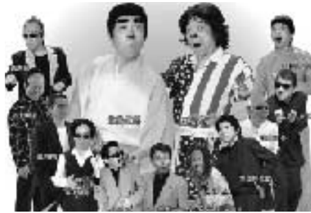
マロン陵・爆笑ものまねライブ