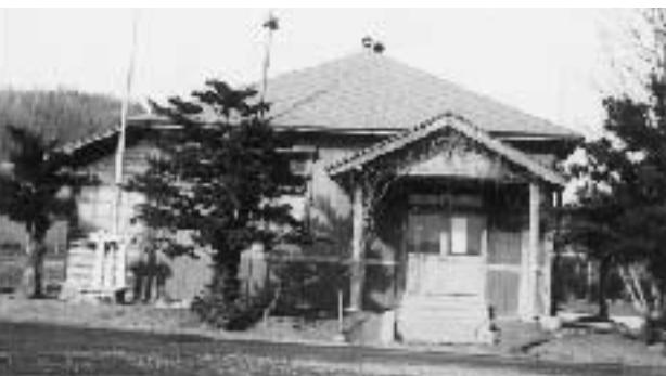
五戸の農事試験場庁舎 (大正11・11・6完成)