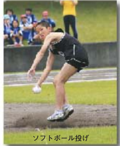
ソフトボール投げ