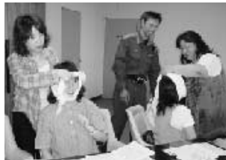
三角巾を使った止血方法を学ぶ児童クラブ指導員

この日は、五戸消防署員の指導の下、参加者は三角巾を使った止血方法や骨折などの固定方法の手順を確認。署員からは「119番通報してから救急車が到着するまで全国平均で約6分かかる」「救急車が到着するまでの応急手当がとても大切」などといった説明がありました。このほか、参加者はたんかを使った搬送方法などを熱心に学びました。