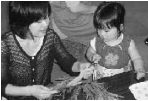
七夕飾りに願い事を書く親子

参加した親子は短冊に「ケーキ屋さんになりたい」「健康で大きく育つように」などと願い事を書いて七夕飾りに飾り付けてから、紙製の金魚やヨーヨーすくいなどの「縁日ごっこ」も楽しみました。