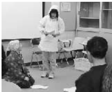
キャラバンメイトが寸劇を通じて認知症の人との接し方について分かりやすく説明

町地域包括支援センター(町介護保険課)はこのほど町立公民館で「認知症サポーター養成講座」を開催しました。