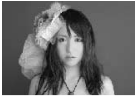
八戸生まれのシンガーソングライター光未〈テルミ〉