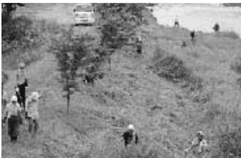
五戸川土手の草を刈る参加者