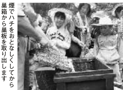
煙でハチをおとなしくしてから巣箱から巣板を取り出します

このほど放課後児童クラブ指導員13人が、救急法・応急手当を学び、児童のけがなどに備えました。 この日は、五戸消防署員の指導の下、参加者は三角巾を使った止血方法や骨折などの固定方法の手順を確認。署員からは「119番通報してから救急車が到着するまで全国平均で約6分かかる」「救急車が到着するまでの応急手当がとても大切」などといった説明がありました。このほか、参加者はたんかを使った搬送方法などを熱心に学びました。