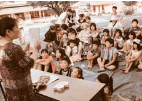
怪談話に聞き入る子どもたち

次に「子ども遊びの広場」スタッフによる怪談話が紹介され、子どもたちが怖い気分になった直後に肝試しを敢行。代官所内に設置したお化け屋敷の暗闇の中を子どもたちが手を繋ぎながら恐る恐る前進。物音などにも「キヤー」と悲鳴を上げて驚き、夏の涼を楽しみました。