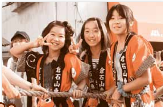
▲ 友達と一緒に記念撮影。思い出づくり。