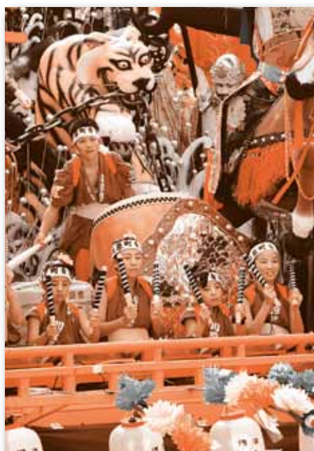
▲ 登り坂ではテンポアップして気合が入る。