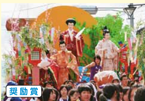
下大町自治会 『川中島決戦～甲斐の虎「武田信玄」 越後の龍「上杉謙信」～』