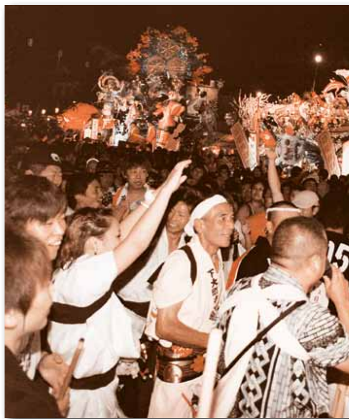
▲ 山車9台が一堂に会して行われた夜間競演。会場に「音頭上げ」がこだまして熱気に満ち、最高潮に達した。