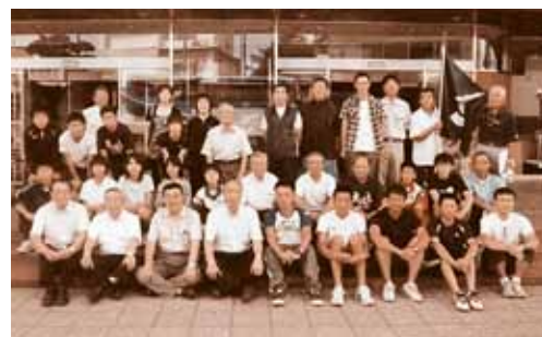
力を合わせて頑張った五戸町チーム

「健脚でつなげ郷土の和と心」をスローガンに市町村対抗第18回青森県民駅伝競走大会