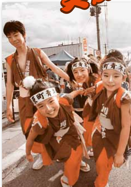
▲ 笑顔いっぱい、山車を引きました。