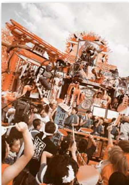
▲ お還りの見所。2台の山車が隣接して喧嘩太鼓が始まった。