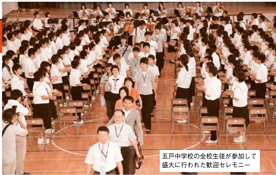
五戸中学校の全校生徒が参加して盛大に行われた歓迎セレモニー

五戸中学校（橘公人校長）では吹奏楽部員による演奏で一行を歓迎。日本舞踊などを披露して交流した後、中庭で記念植樹を行い両町・郡の友好関係を深めました。送別会には今年、沃川郡を訪問した町の中学生19人も参加。言葉の壁を越えて身振り手振りで交流し、互いに別れを惜しんでいました。