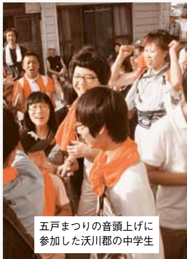
五戸まつりの音頭上げに参加した沃川郡の中学生