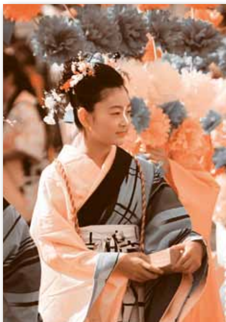
▲ ちょっと一休みです。