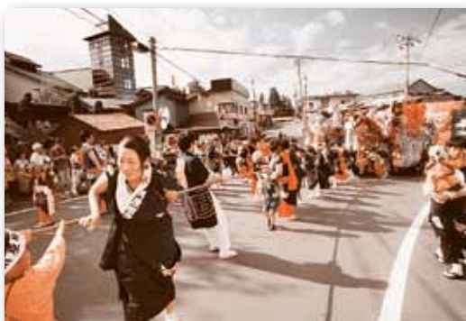
▲ 図書館横の堀合坂は最大の難所。勢いを付けて一気にひっぱり上げます。