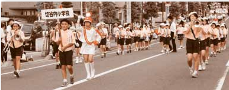
▲ 小中学校鼓笛隊パレードで祭りが開幕。