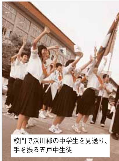
校門で沃川郡の中学生を見送り、手を振る五戸中生徒