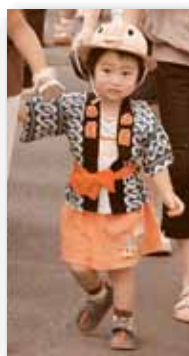
▲ まつり衣装が似合うでしょ!