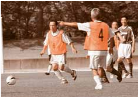
ドリブルで攻め上がる東京五戸会チーム

東京五戸会チームは60代を中心とした20人。対する地元チームは江渡クラブ。和やかな雰囲気です。試合が行われ、さわやかな笑顔で、互いの健闘をたたえ合いました。