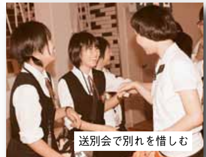
送別会で別れを惜しむ