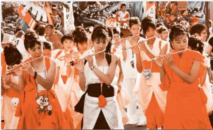
▲ 息の合った笛の音が響き渡り山車運行が始まりました。