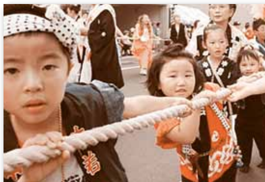
▲ 坂道も頑張ります！