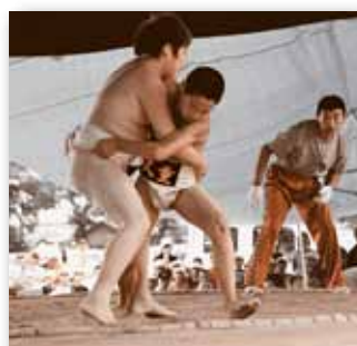
▲ 小・中学校親善相撲大会。息が詰まるほどの接戦の連続。