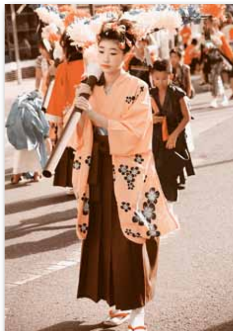
▲ 鮮やかな着物姿。可憐優雅な花担ぎは祭りに彩りと華を添えました。