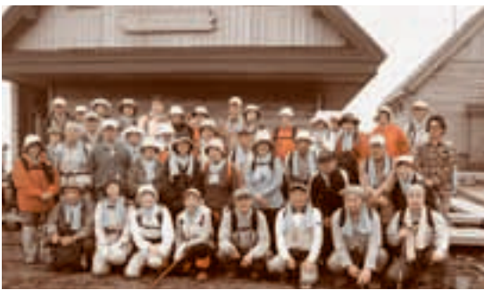
▲ 全員が山頂へ。笑顔で記念撮影

当日は山頂付近で霧が立ち込めていましたが、全員が踏破に成功。時期的に少し早かったものの「高山植物の女王」コマクサのピンク色の花を見ることができました。