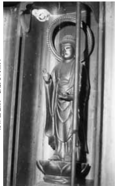
太田家の秘佛・薬師如来像

慶応4年、戊辰戦争では奥羽総鎮総督(官軍)九条道孝の転戦に随行、八戸へ官軍密使(大山格之助=薩摩藩士)が潜行、白銀海岸で官軍の孟春号難破による乗員81人の上陸事件があった。