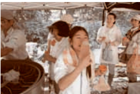
▲ 搾りたての蜂蜜の香りに表情ゆるむ

蜜蝋（蜜を採取した後の蜂の巣）に直接かぶりついてなめてみた参加者は、自然の恵み蜂蜜の甘さに思わず歓声を上げていました。