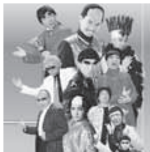
ダンシング谷村・爆笑ものまねライブ