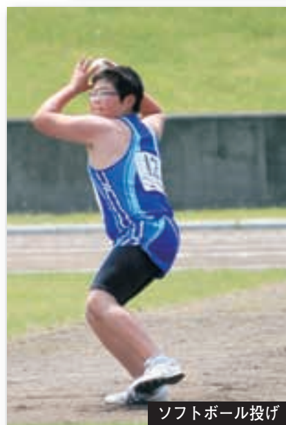
ソフトボール投げ