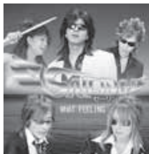
バンドステージ「セーリング」