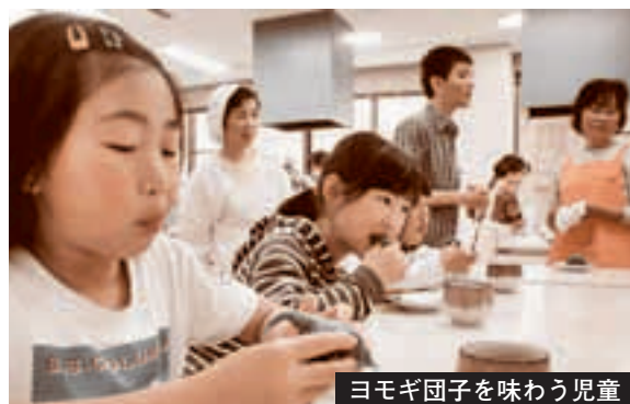
ヨモギ団子を味わう児童

町では「子どもあそびの広場」を毎週水曜日と金曜日に町立公民館で開設しています。地域の大人が指導員やボランティアスタッフとなり、遊びや体験・交流を通して心豊かな子どもを育むのが目的。今回は小学生18人が博労町婦人会員らの指導の下、ヨモギ団子作りに挑戦。自分の手で生地を伸ばし、あんこを入れて仕上げ、味わっていました。