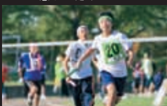
年齢別混合リレー