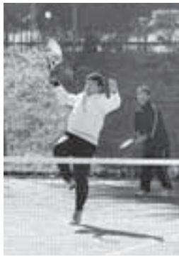
▶ 笑顔で元気にプレイ

自分のレベルに応じたクラスに出場できるため、初心者・上級者問わず楽しめるこの大会。当日は、青空が広がる爽やかな天気の下、参加者は元気なプレイぶりを見せていました。