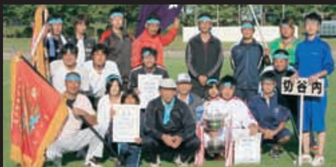
優勝した切谷内チームの皆さん

秋晴れとなった9月25日、第43回五戸町民運動会がひばり野公園陸上競技場で開催されました。各町内13チームと、米海軍三沢基地情報運用隊チーム(NIOC)から参加した選手たちは、家族や地元の声援を背に玉入れやむかで競走、リレーなど全16種目の競技に爽やかな汗を流しました。結果は、切谷内チームが2年連続8度目の優勝を遂げました。