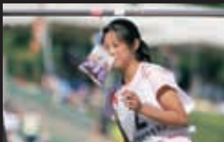
障害物パン食い競走