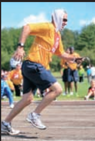
うなぎつかみレース