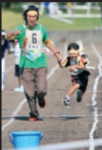
なかよし親子レース