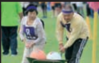
息ぴったりレース