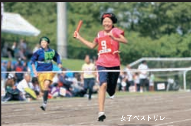
女子ベストリレー