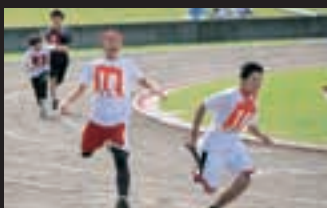
男子ベストリレー