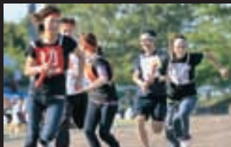
年齢別混合リレー