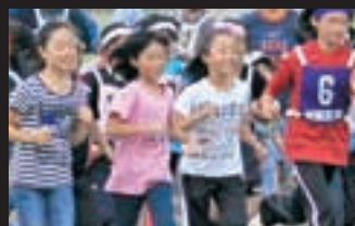
町民健康マラソン