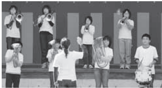
芝生広場で元気に演奏した中市小児童