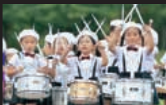
江渡幼稚園マーチング