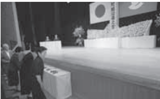
▲ 霊前に菊の花を供える遺族の皆さん

出席者は、幾多の犠牲の上にある今日の平和への思いと「二度と過ちを繰り返さない」という誓いを胸に、霊前に菊の花を供えて戦没者の冥福を祈りました。