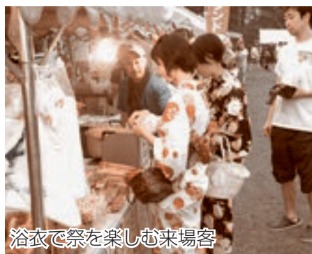
浴衣で祭を楽しむ来場客