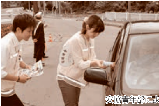
安協青年部による街頭キャンペーン