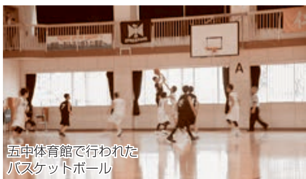
五中体育館で行われたバスケットボール

夏休み中の非行防止を目的としたこの大会、開会式では「部活動に熱心に取り組む、非行のないよう頑張ってもらいたい」と激励され、選手たちは日頃の練習成果を発揮しました。