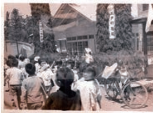
川原町の歓迎アーチ (昭和10年5月吉日)

また、第2会場は新丁の立場公園であったが、その後、ひばり野公園、続いて小渡平公園と変わる。