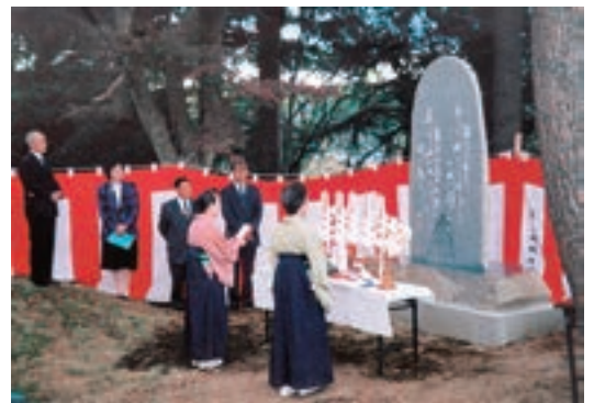
与謝野鉄幹夫妻の文学碑除幕式 (平成10年11月9日)

て歩き、奥入瀬溪流を散策、子ノ口、宇樽部、休屋と天下の景勝地に一泊、貴町の一声は「みぞれでふるえた」と。菊万の庭園で名士30人が記念の写真に納まり、その時の祖父や父の写真を子孫は大切に保存している。