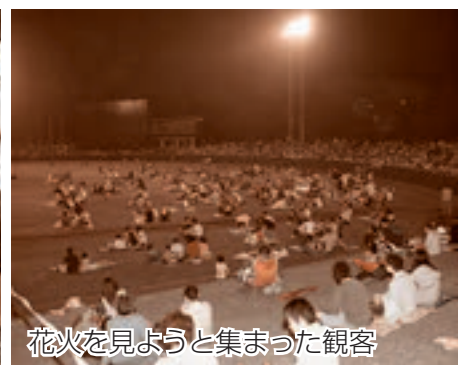
花火を見ようと集まった観客