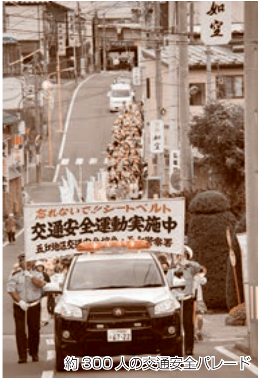
約300人の交通安全パレード