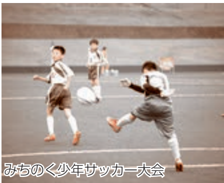
みちのく少年サッカー大会

の扇田駐車帯で道行くドライバーに冷たい飲み物と交通安全うちわ、パンフレットを配り安全運動を呼びかけました。