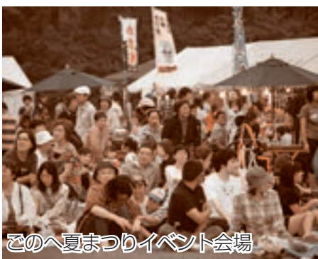
ごのへ夏まつりイベント会場

今年で8回目となる「ごのへ夏まつり」が8月4日と5日の2日間、ひばり野公園で開催されました。