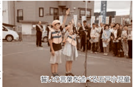
誓いの言葉を述べる五戸小児童