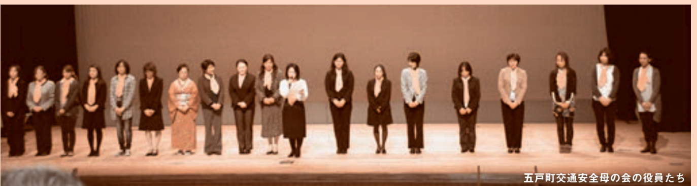
五戸町交通安全母の会の役員たち