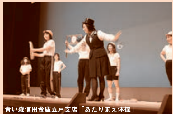
青い森信用金庫五戸支店「あたりまえ体操」

▼五戸警察署は、署員による演劇が披露され、その脚本と演技力で観客を沸かせていました。