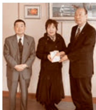
■つくしの会より人材育成基金として