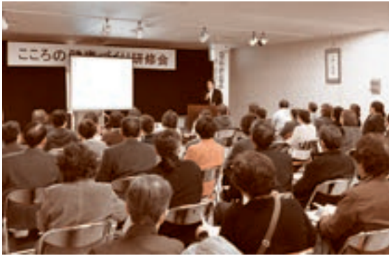
●11月12日 こころの健康づくり研修会 地域で取り組む自殺予防 誰もがゲートキーパー