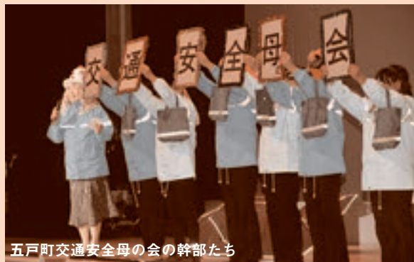
五戸町交通安全母の会の幹部たち

▼五戸町交通安全母の会からは、幹部たちが反射材の効果を伝えたいという思いから、ウインドブレーカーや買い物袋、傘、反射シールなどを身に着け、照明で反射させながら舞台上を右へ左へと踊りました。