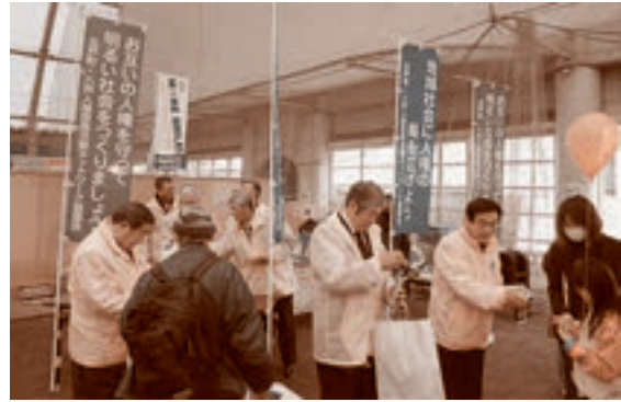
●11月3日 人権啓発活動を展開 八戸人権擁護委員協議会五戸地区部会