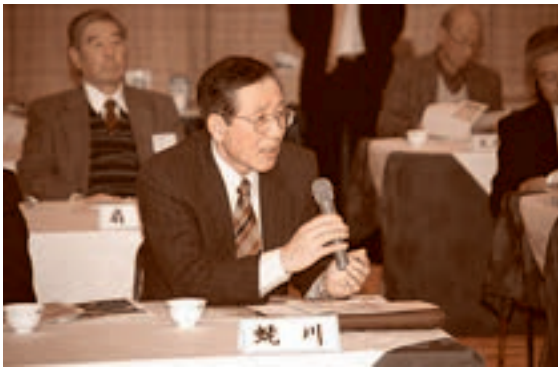
●11月29日 平成24年度自治会長研修会開催 原子燃料サイクル事業について学ぶ

五戸町産業と文化まつりの五戸ドーム会場において、来場者へ人権相談を周知するチラシと啓発物品を配布し、人権を尊重し、思いやりの心を持つことの大切さを呼びかけた。