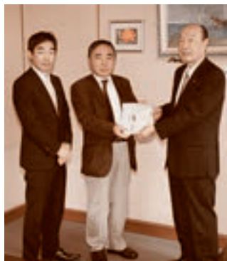
■青銀Mastersより人材育成基金として