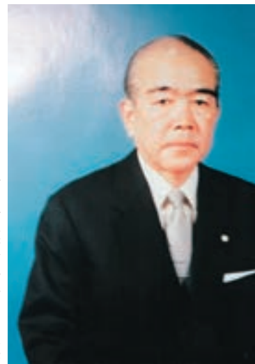
（写真）横須賀防衛大学校長

ハガキは昭和57年8月23日付の消印があり、東京から横須賀防衛大学校長に転任、五戸には背広姿で訪れて署員の案内を受けている。