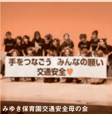
みゆき保育園交通安全母の会