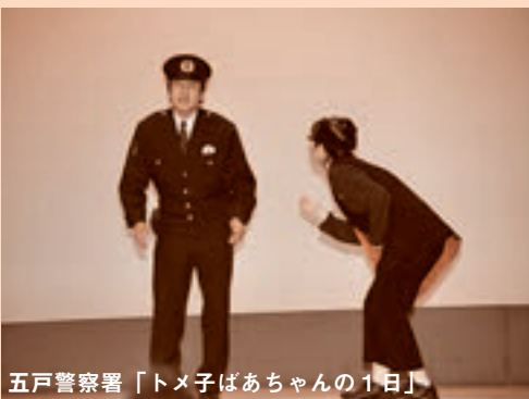
五戸警察署「トメ子はあちゃんの1日」

▼五戸警察署は、署員による演劇が披露され、その脚本と演技力で観客を沸かせていました。