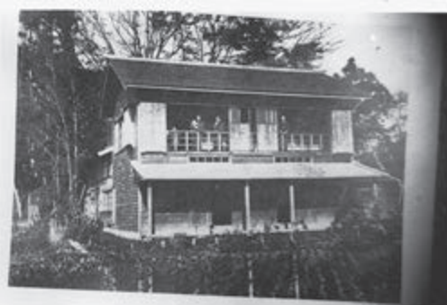
【写真】油出入口に建てた2階建ての大湯温泉

には「松の湯」、下大町盛立近くに「鶴の湯」の銭湯も店開きしたが、時代の流れとともに銭湯の休業がはじめている。