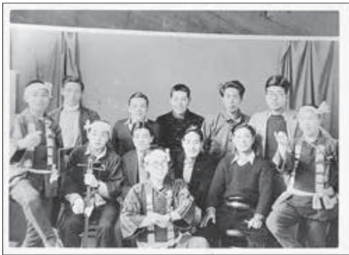
【写真】昭和13年3月18日撮影 青年団慰安の夕べ（消防小唄）

明治期は青少年の運動会と少年野球で盛り上がる。ルールが分からないため東京方面に住む郷土出身の学生から聞いて知るようになった。昭和期は若者たちの弁論大会や芸能発表会が流行、各地区代表