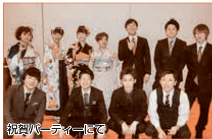
祝賀パーティーにて