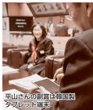
平山さんの副賞は韓国製タブレット端末