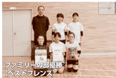
ファミリーの部優勝 【ベストフレンズ】

平成26年12月21日(日)、倉石スポーツセンターにおいて標記大会を開催しました。フリーの部13チーム、ファミリーの部5チーム、計18チーム(107名)が参加。予選リーグ実施後に、順位トーナメントを行いました。(ファミリーの部はリーグのみ。)今年度のフリーの部は、参加チームの実力が均衡しており、白熱した試合が多く、ファミリーの部は、一生懸命プレーする小学生の姿が印象的でした。誰でも参加しやすいのがソフトバレーボール。友人、職場、そして家族などでチームを形成し、来年度も是非、参加いただければと思います。結果は次のとおりです。