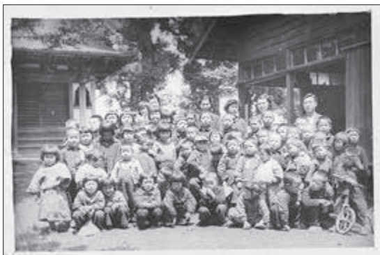
【写真】（昭和29年5月下旬）川原町喜光庵境内の子ども達、後ろには世話人の女子青年