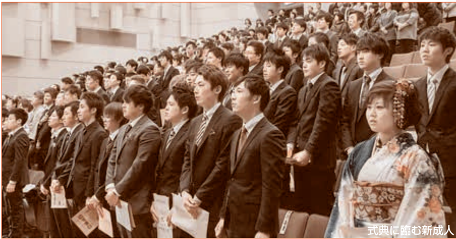
式典に臨む新成人

平成26年五戸町成人式が1月11日（日）、町立公民館で開催された。対象者210人（男108人、女102人）のうち134人が参加し、少年五戸太鼓のアトラクションとエールを受けた。町では平成12年度から、新成人たちが自ら実行委員として、式を企画運営している。今回は左記の12人が実行委員を務めた。