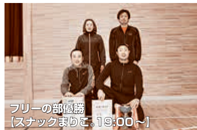
フリーの部優勝 【スナックまじこ。19:00～】