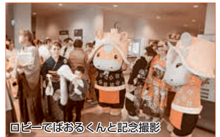
ロビーでぼおるくんと記念撮影