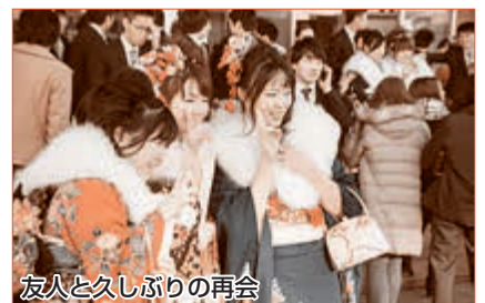
友人と久しぶりの再会