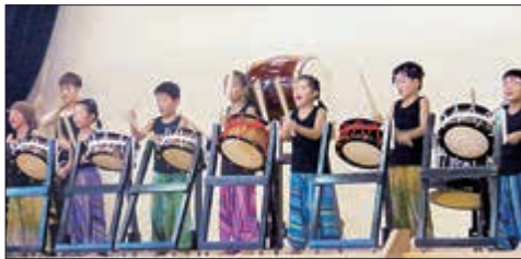
上市川和太鼓キッズの演奏の様相

地区ごとに、それぞれ特色があり、短い時間ではありましたが、おじゃま出来て楽しかったです。みなさんもぜひ、行ったことのない近所のお祭りがありましたら、足を運んでみてはいかがでしょうか。そして各地区の夏祭り運営スタッフのみなさん、大変お疲れ様でした！