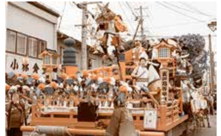
奨励賞 五戸高等学校 牛若 ～義経生涯～