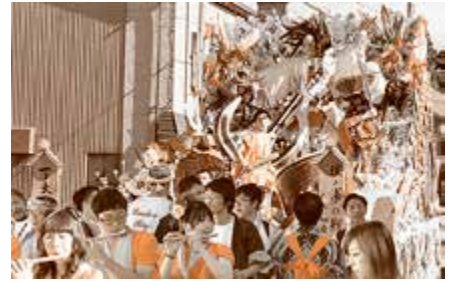
奨励賞 下大町自治会 壇浦の戦い