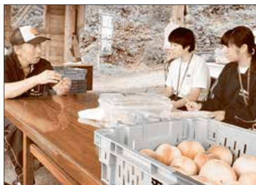
→竹洞さんの話を真剣に聞く2人

ちなみに、この帽子は、親戚に(絵を描いたりするところが)得意な子がいてね。10個ぐらいイベント用とかに作ったんだよ。