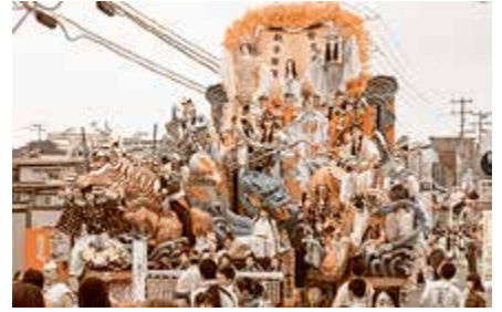
優秀賞 ひばり野自治会 スーパー歌舞伎・京劇 ～龍王～