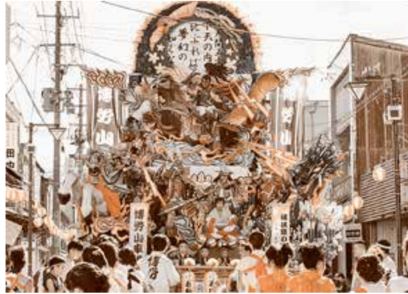
最優秀賞 博労町自治会 桶狭間の戦い ～第六天魔王降臨～