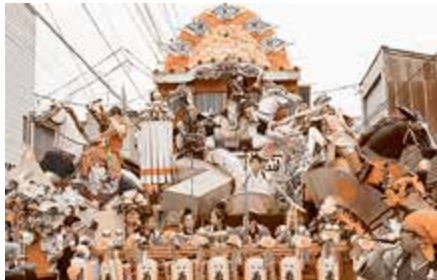
奨励賞 上大町自治会 臥竜天昇 独眼竜政宗