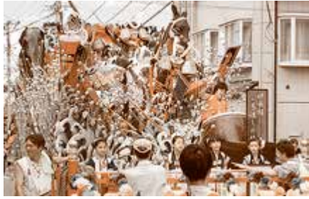
特別賞 新町自治会青年部 義経の弓流し