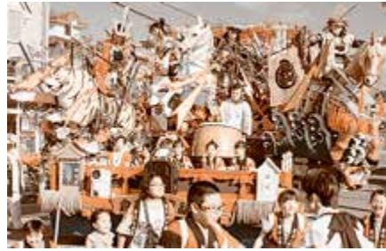
特別賞 倉石山車組 独眼竜 ～関ヶ原の戦いと最上陣～