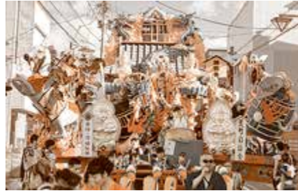
優秀賞 荒町自治会 安珍・清姫伝説