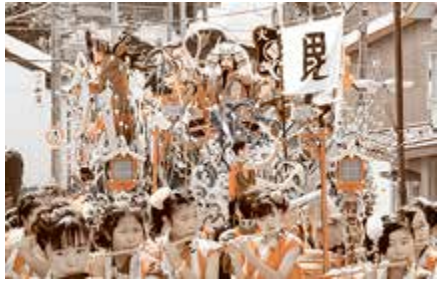
特別賞 川原町青年団 激突 甲斐の虎 越後の龍