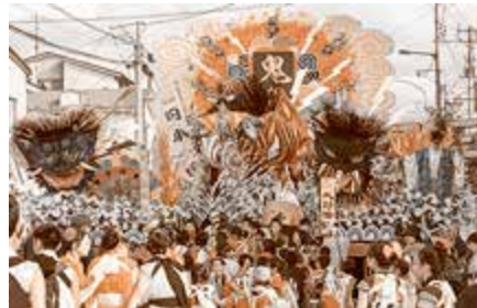
奨励賞 蛭川学区お祭り会 桃太郎伝説