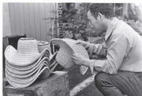
【写真】青銀五戸支店前でのバオリ売り 昭和61年4月17日

しかし昭和40年代となってビニール製の雨具やふる敷、スカパーなどが出廻り、軽く安いため、バオリの需要が減り、水田にイグサを植える農民もなく、後継者不足から五戸地方のバオリは商売にならなくなった。