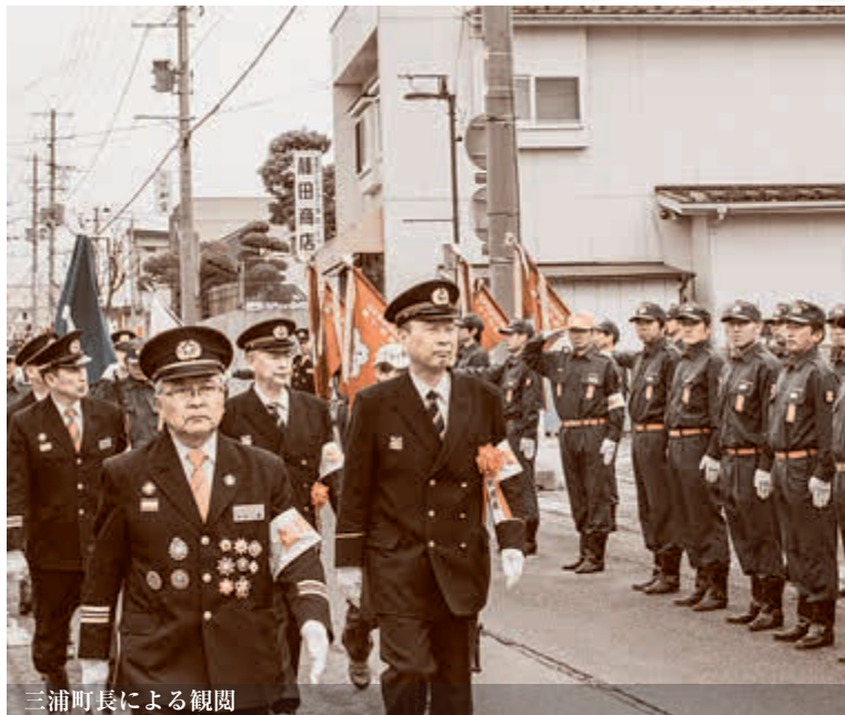
三浦町長による観閲