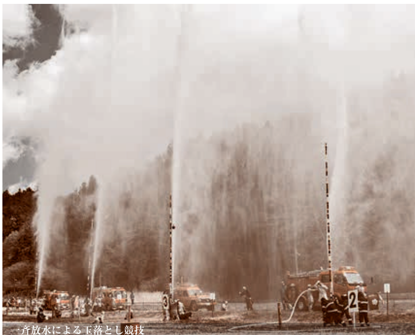
一斉放水による玉落とし競技

引き続き五戸小学校を会場にして行われた式典では、永年勤続者や功労者などに表彰状が贈呈されました。 その後、五戸小学校北側の用水路沿いに会場を移して恒例の「玉落とし大会」が行われ、会場を賑わせました。 団員らは玉を入れたドラム缶めがけて放水。水を溜め、玉を外に出すと、今度は、高さ9メートルの柱の先に結び付けられた玉をめがけて下から一斉に放水。一面を水壁で飾り、大勢の観客から声援を受け競い合いました。