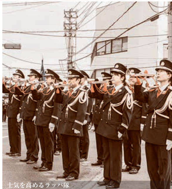
士気を高めるラッパ隊